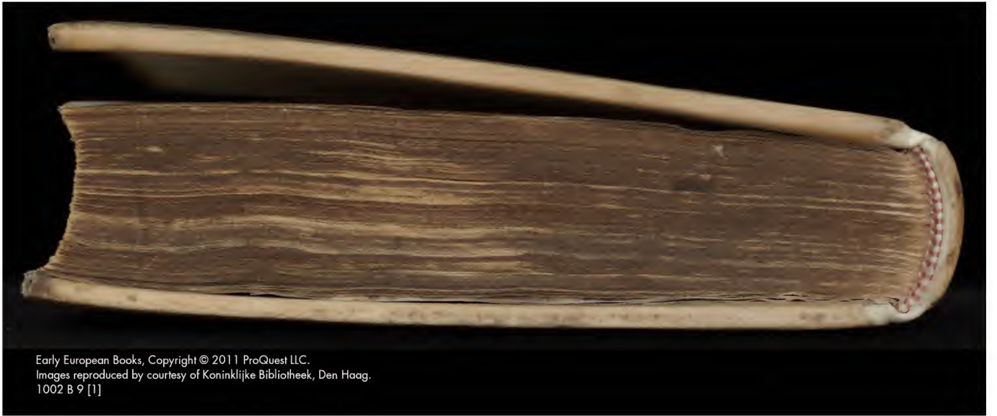
1002 B 9 [1]