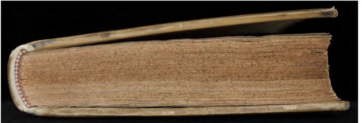
Early European Books, Copyright © 2011 ProQuest LLC. Images reproduced by courtesy of Koninklijke Bibliotheek, Den Haag. 1002 B 9 [1]