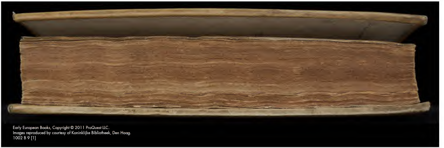
1002 B 9 [1]