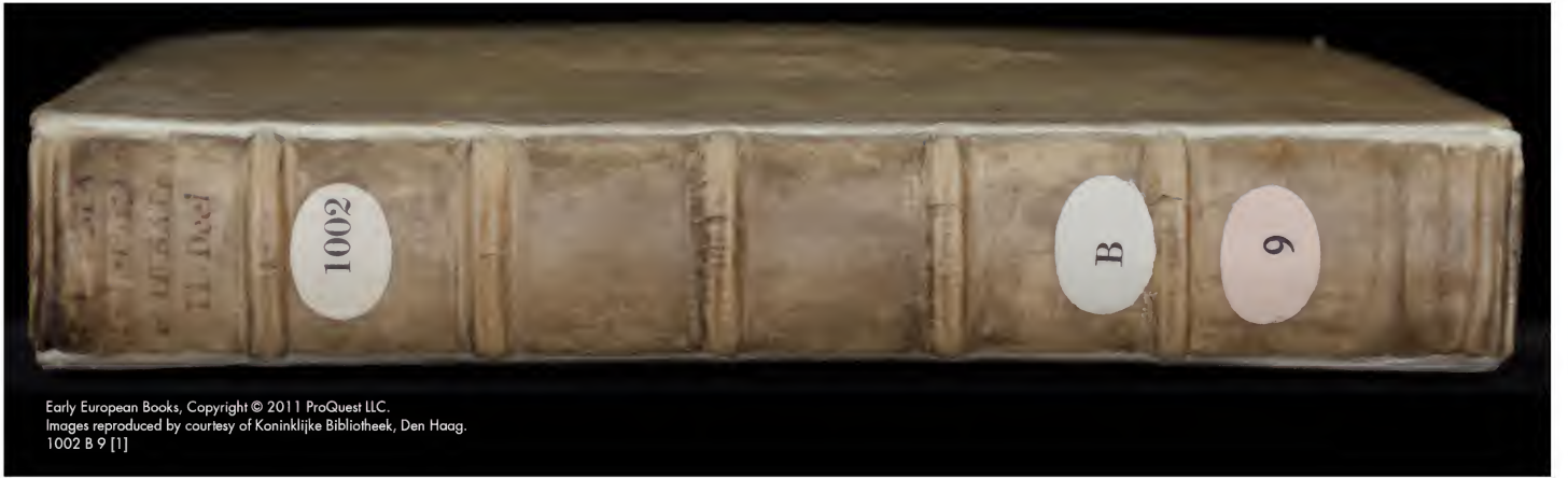
1002 B 9 [1]