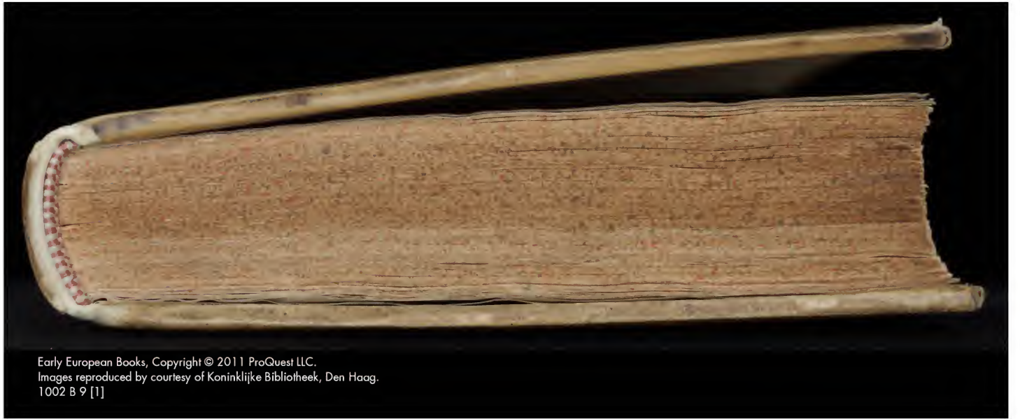
Early European Books, Copyright © 2011 ProQuest LLC. Images reproduced by courtesy of Koninklijke Bibliotheek, Den Haag. 1002 B 9 [1]