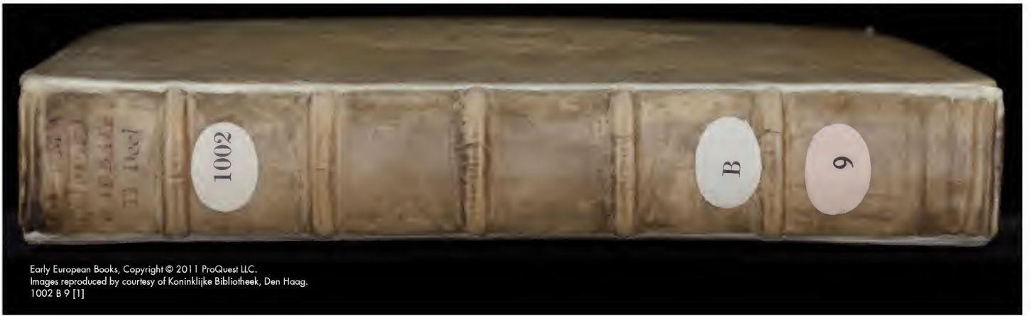
1002 B 9 [1]