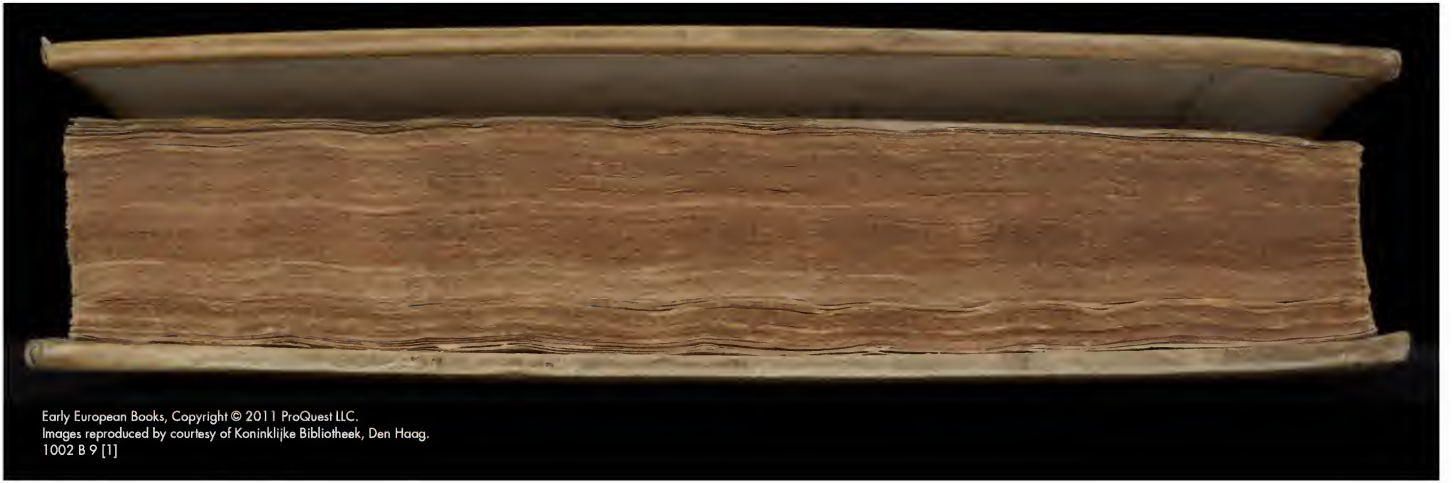
Early European Books, Copyright © 2011 ProQuest LLC. Images reproduced by courtesy of Koninklijke Bibliotheek, Den Haag. 1002 B 9 [1]