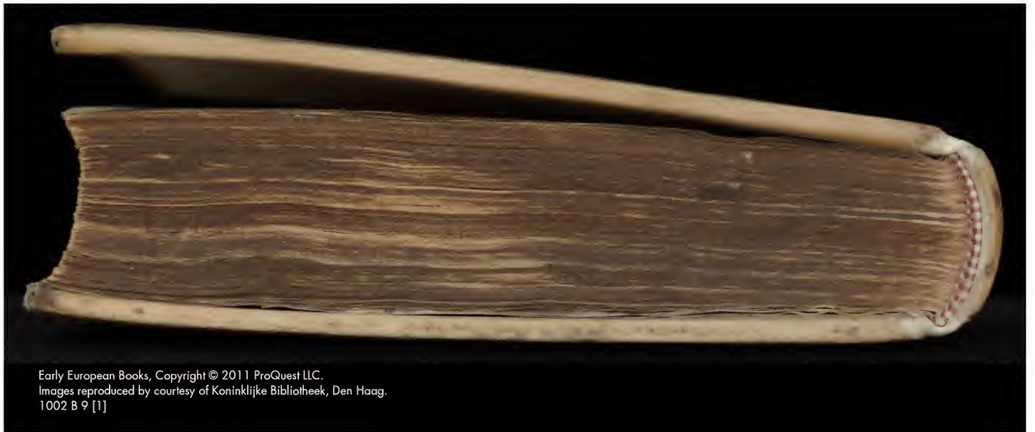
Early European Books, Copyright © 2011 ProQuest LLC. Images reproduced by courtesy of Koninklijke Bibliotheek, Den Haag. 1002 B 9 [1]