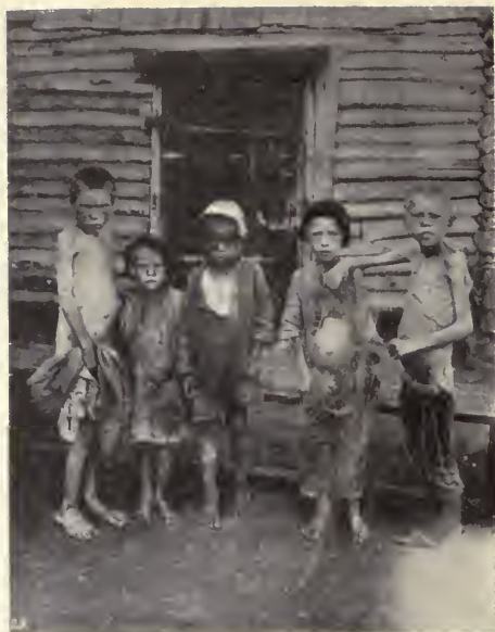
Niños hambrientos en Saratof