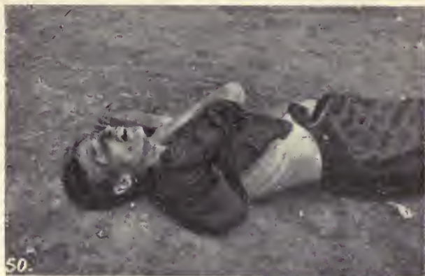
Un muerto de hambre