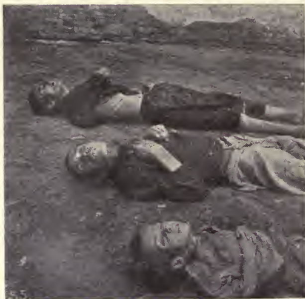
Muertos de hambre en una calle Digitized by Microsoft®