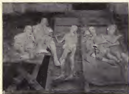
Cadáveres de niños en el patio de un hospital