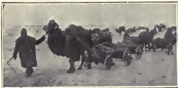
Transporte de provisiones en el Volga