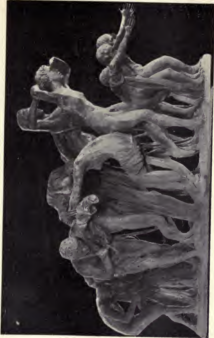
Otro aspecto del "Canto al Trabajo"