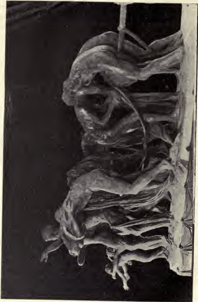
“Canto al Trabajo”