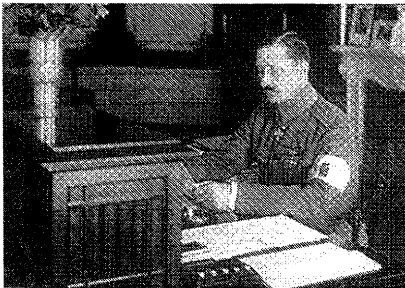
Рис. 5. Главнокомандующий К. Г. Маннергейм.

влечения иностранной помощи. При этом наметились серьезные разногласия между Маннергеймом и финляндским сенатом. Маннергейм возглавил финскую армию с категорическим условием: сенат не станет обращаться за вооруженным содействием ни к Швеции, ни к Германии, ни к какому-либо другому государству. По его мнению, достаточно было привлечь добровольцев, а также получить помощь оружием и прочими военными материалами. В своих воспоминаниях Маннергейм, в частности, подчеркивал, что «свобода народа должна быть куплена собственными усилиями, собственными испытаниями и кровью своих собственных сыновей». 18 Уверенность генерала имела в своей основе патриотизм борющегося за независимость народа. Он также знал о скором возвращении из Германии финляндских егерей, что позволило бы компенсировать недостаток военных специалистов. Определенные надежды генерал возлагал и на по-