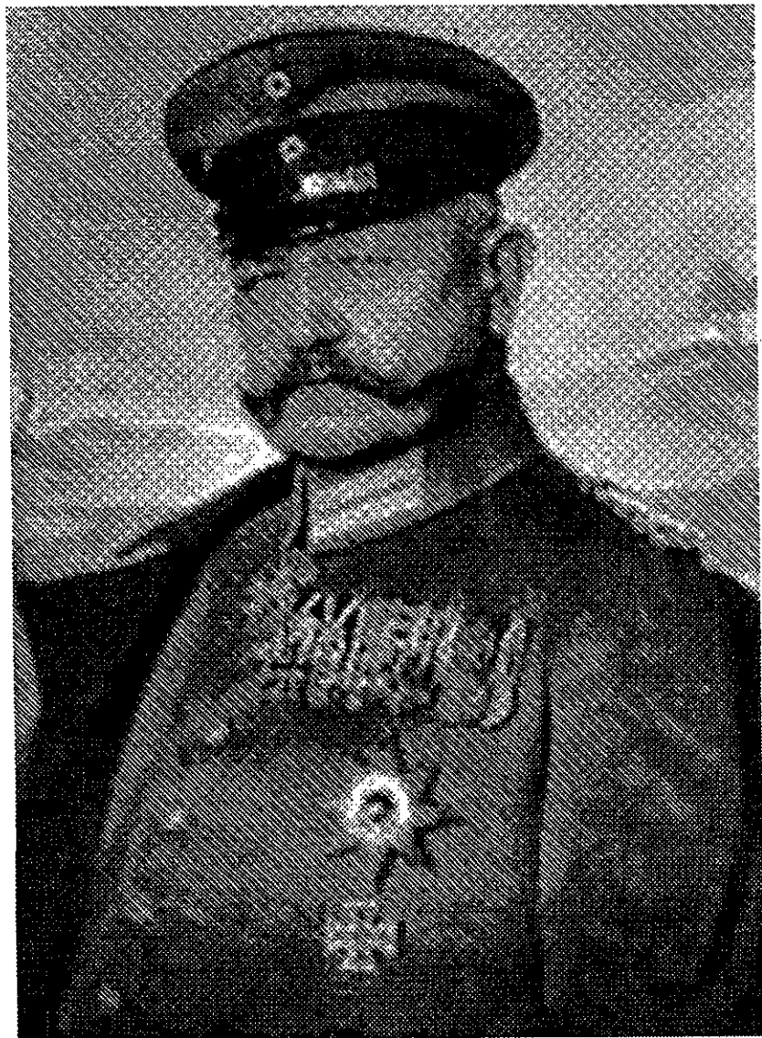
Рис. 3. Фельдмаршал П. фон Гинденбург.