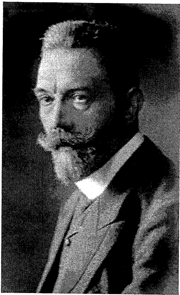
Рейхсканцлер Т. фон Бетман-Гольвег.