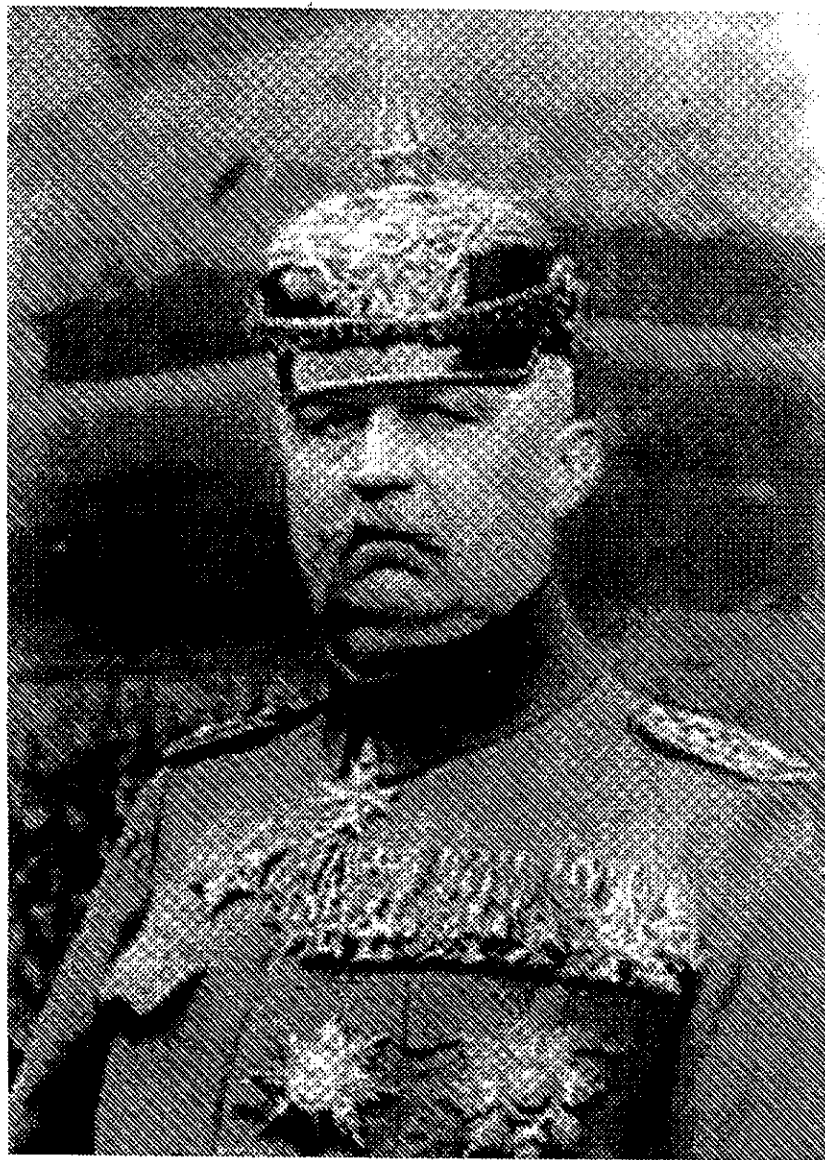
Рис. 4. Генерал Э. Людендорф.