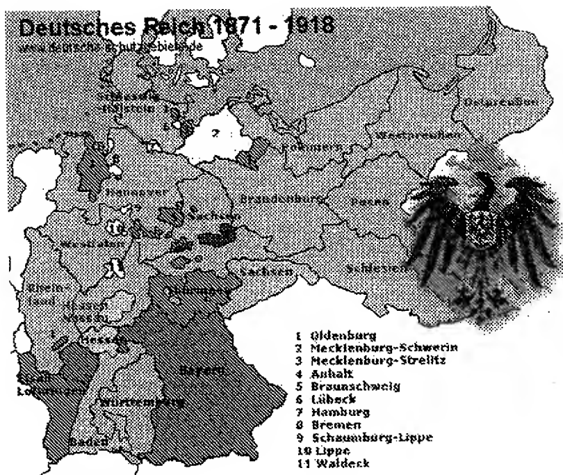
Германская империя 1871–1918 гг.