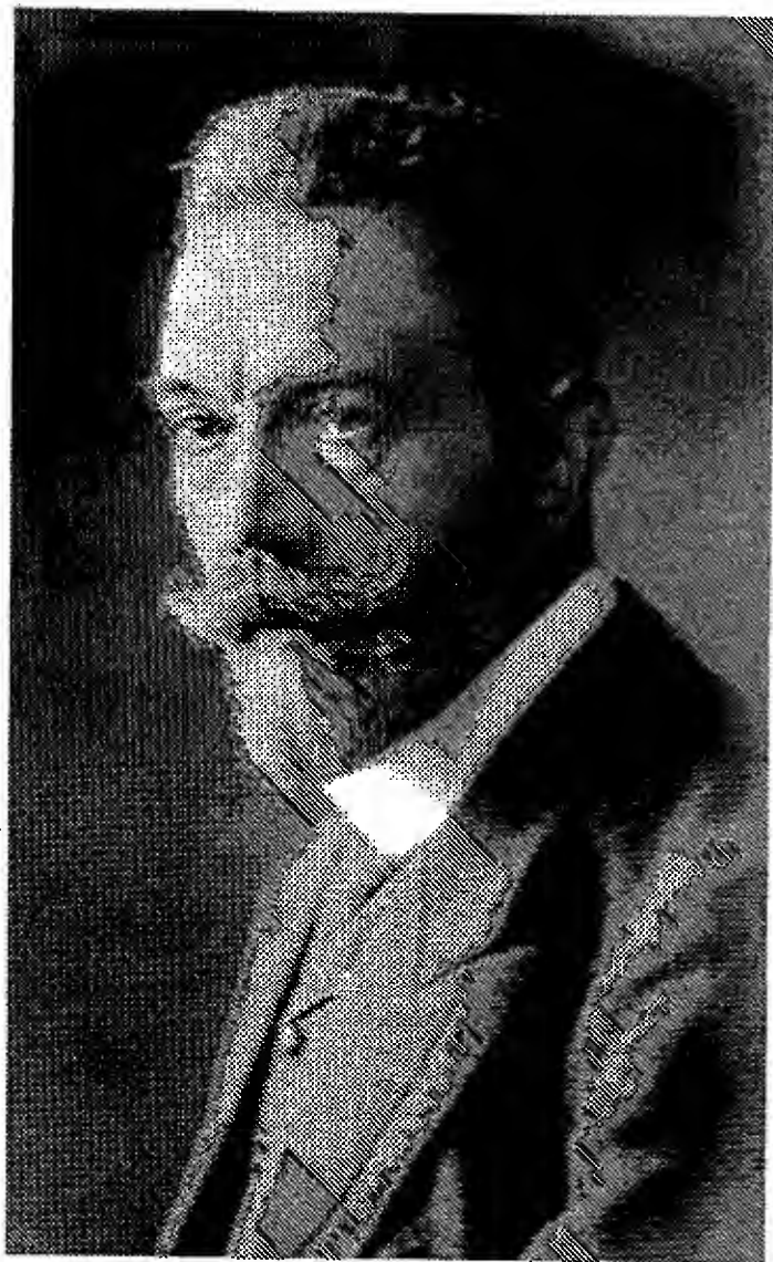
Рейхсканцлер Т. фон Бетман-Гольвег.