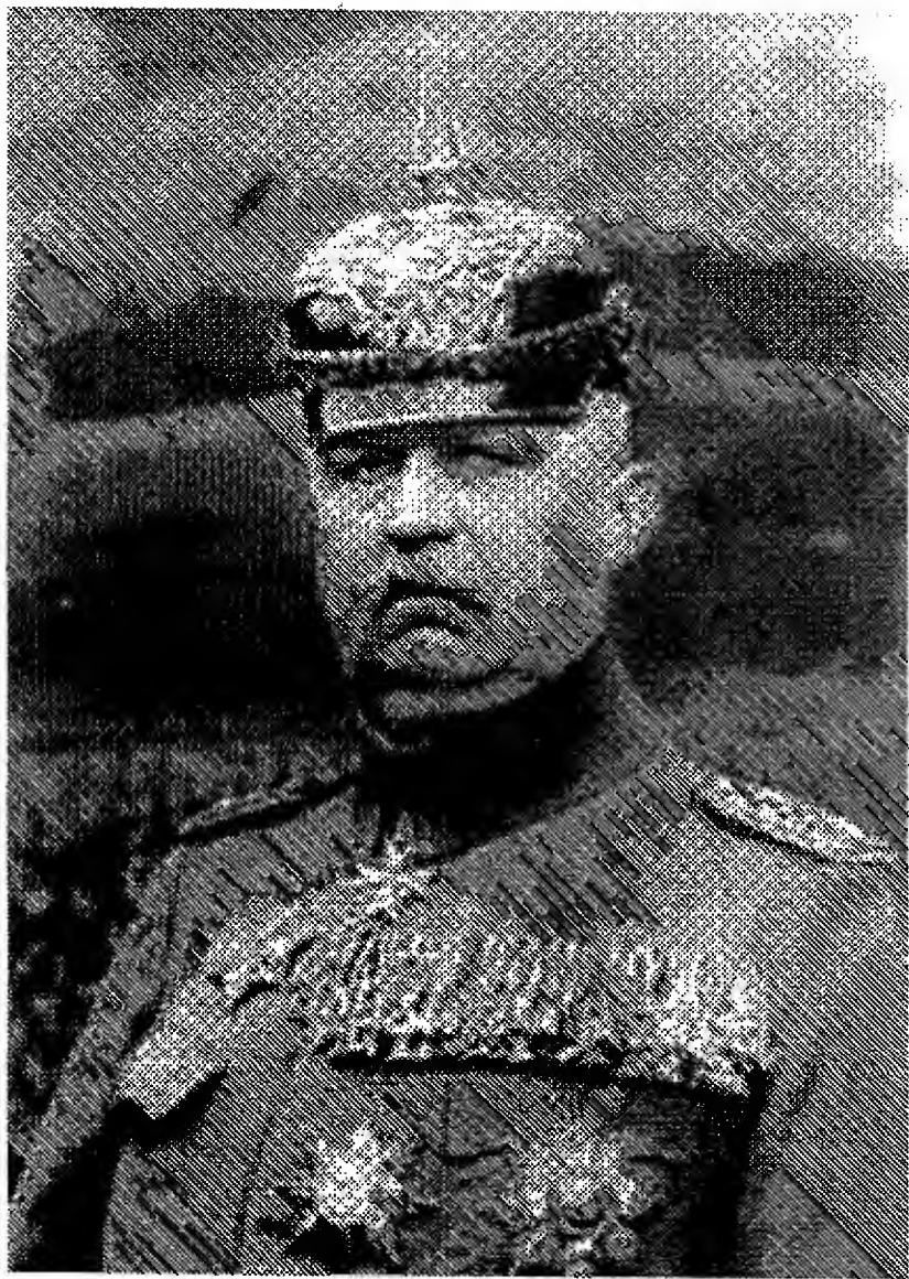
Рис. 4. Генерал Э. Людендорф.