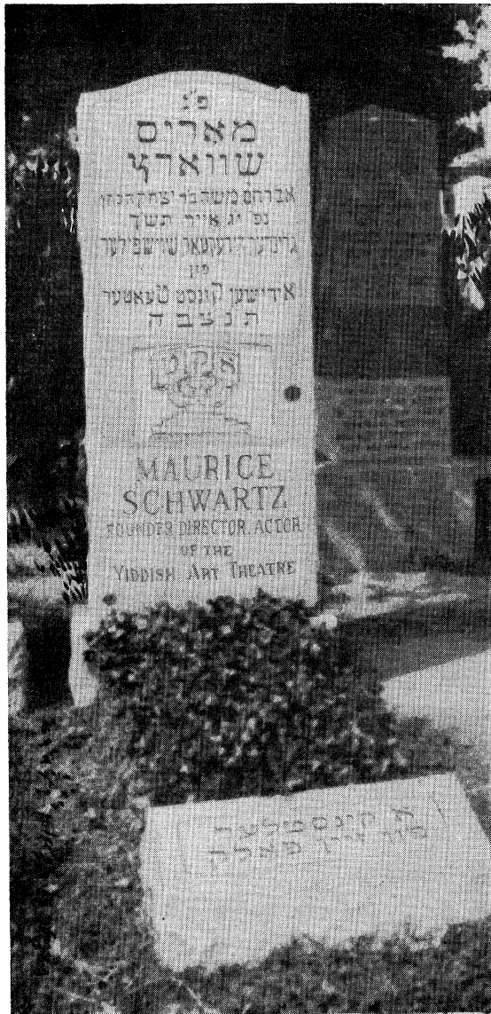
איד וועל אים קיינמאל ניט פארגעסן.