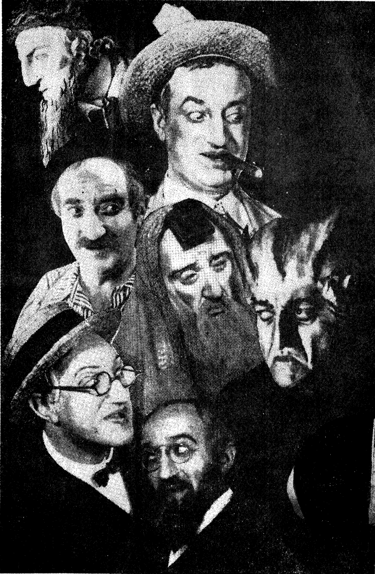
מארים שווארץ אין זיינע שאפונגען