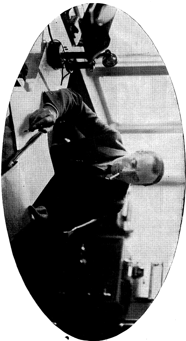
מג'רטי שווארץ אקס דער נייער „שטעקספיער“