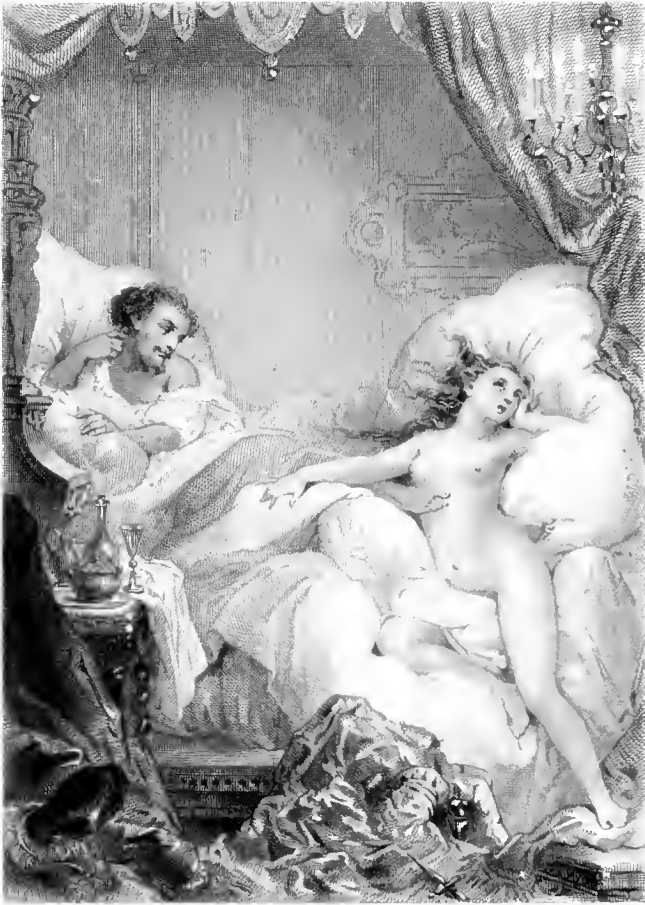
J. Staal del.