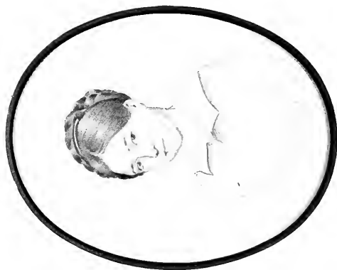
LEONORE VICTOR HUGO

DESSINS DE M me VICTOR HUGO. — MAISON DE VICTOR HUGO.