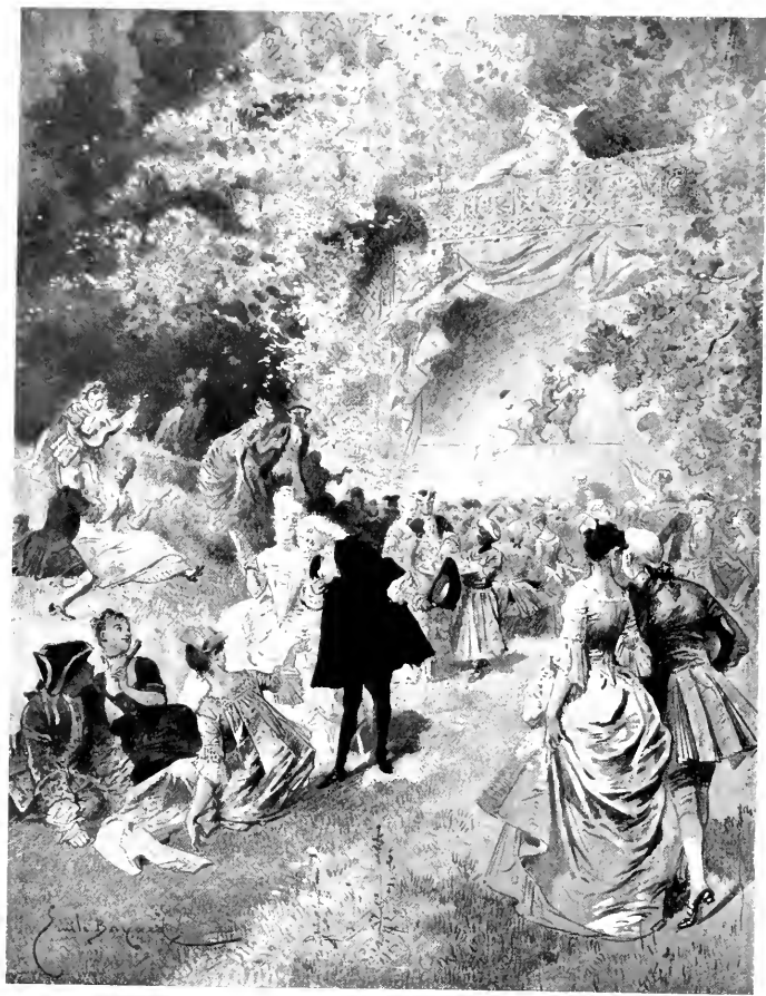
LA FÊTE CHEZ THERESE. COMPOSITION D'ÉMILE BAYARD. ÉDITION EUGÈNE HUGUES.