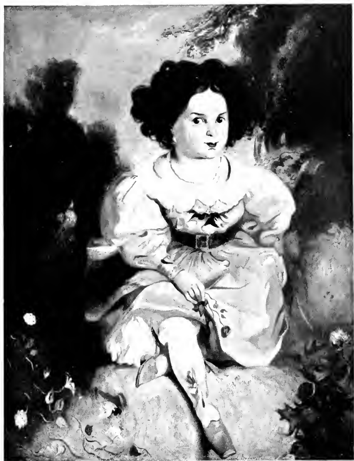
LEHOLDINE ENFANT PEINTURE DE LOUIS BOULANGER. MAISON DE VICTOR HUGO.