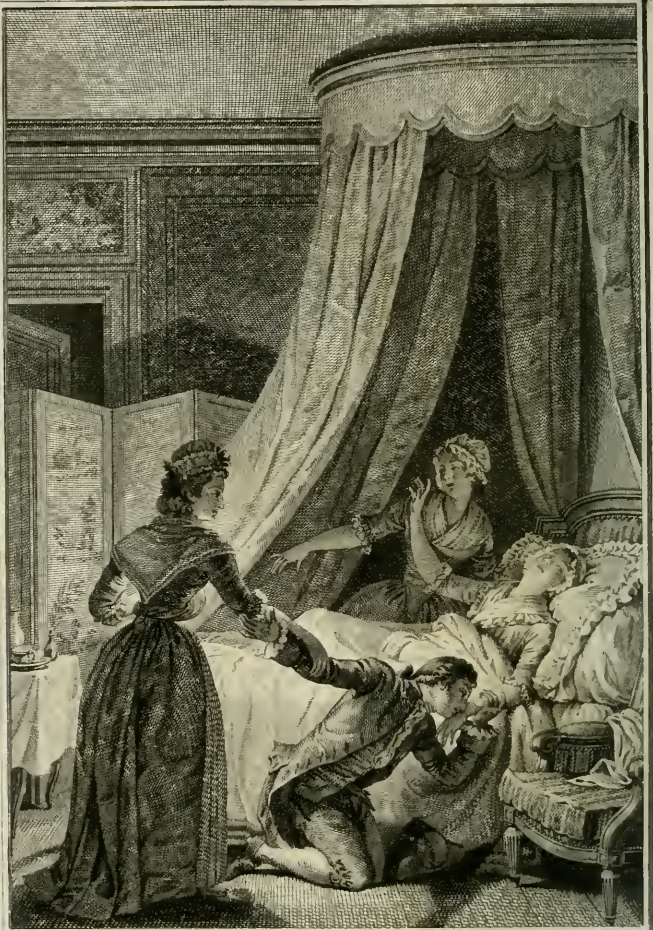
L'Inoculation de l'AMOUR.