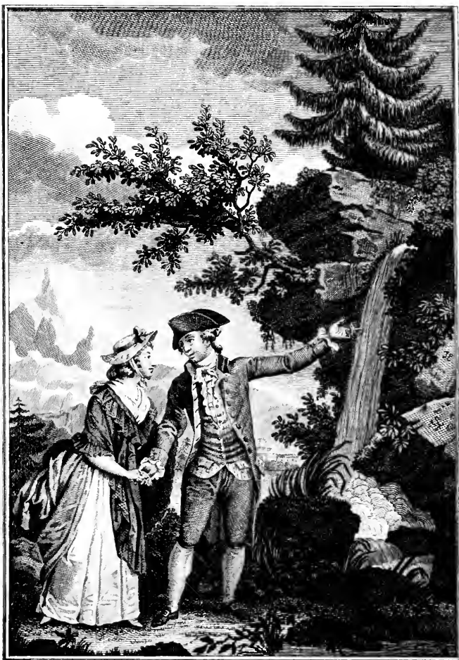
M me de Wolmar et S t Preux sur les rochers de Meillerie.