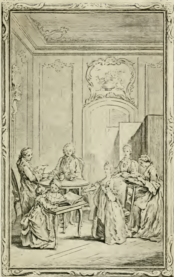
Fig. 1. 1749.