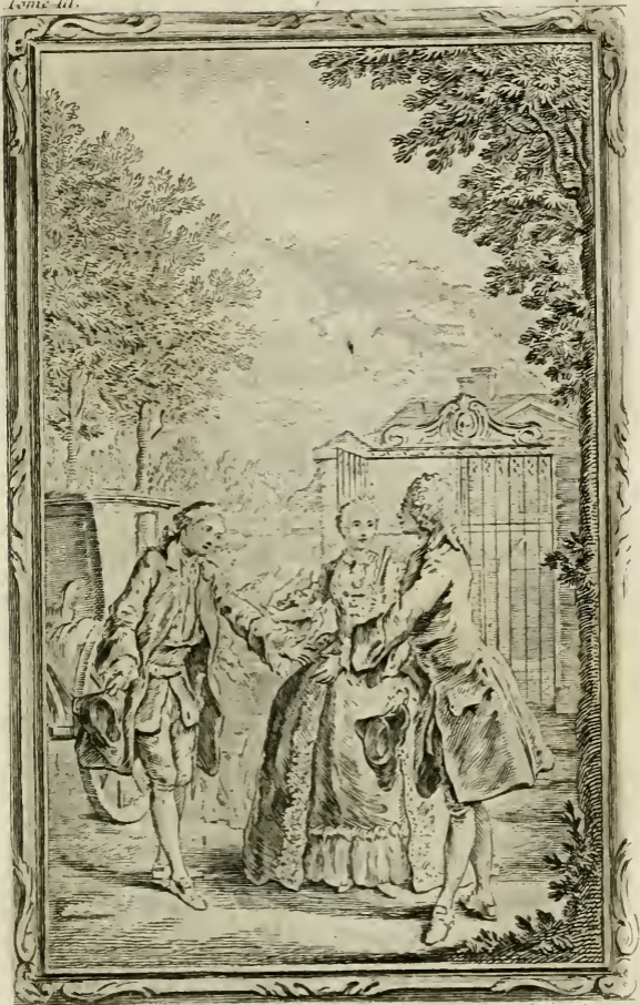
Les amis de l'ellet aux