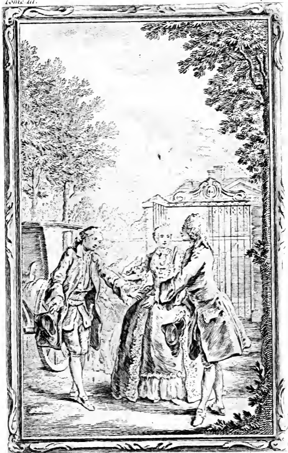
The Countess of ...