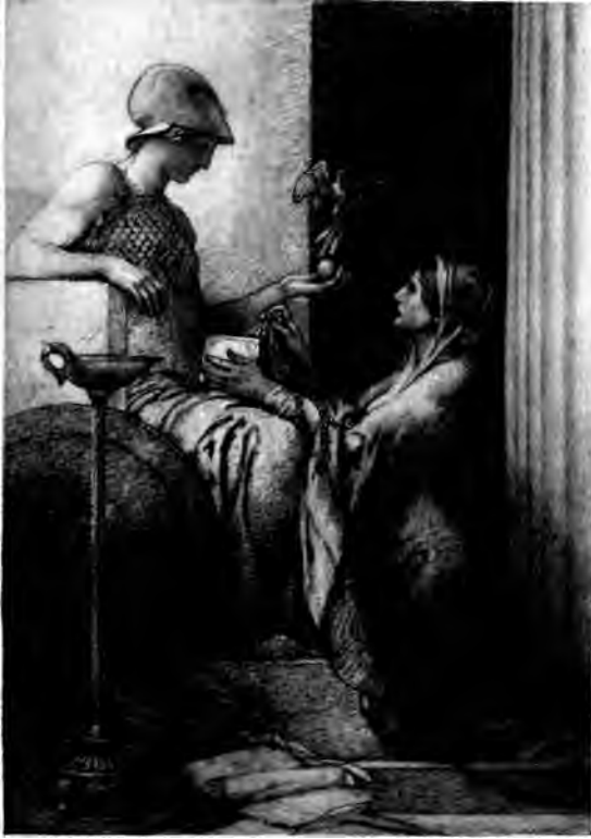
LELAND STANFORD JUNIOR UNIVERSITY