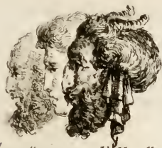
Algarotti inv. F. Novelli sc.

scrittore, dipende dai provvedimenti del principe, ed è in mano sua; ma il trovarvi di quei filoni, onde venga ad arricchire veramente lo stato, si sta nell'arbitrio della fortuna (1): pur nondimeno egli sembra, che tanto più sia da sperare di trovar nella miniera una qualche abbondante e ricca vena, quanto più di diligenza verrà posto e di studio nel lavoro della stessa miniera: