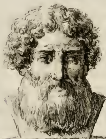
Alvarottus inv. F. Novelli sc.

52 SAGGIO SOPRA L' ARCHITETTURA ; ti una cieca pratica : e così egli , condu- cendo gli uomini nelle vie del vero , con- tribuirà al bene della civile società ; simi- le all' antico Socrate , il quale fu forse ca- gione , che si emendassero al tempo suo non poche leggi ed abusi ne' già stabiliti governi , se non gli fu dato di poter fon- dare una nuova repubblica .