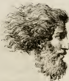
Alcavetta inv. F. Novelli sc

mezzo tra il fumo di Troja si vede nel fondo del teatro risplendere l'aureo Campidoglio; e seguita un coro degli dei, e un ballo dei genj protettori di Roma.