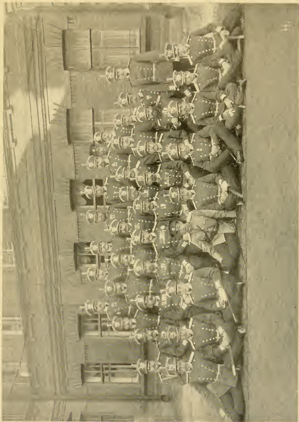
Группа офицеровъ лейбъ-гвардіи 2-го стрѣлковаго Царскосельскаго полка, снятая 21-го сентября 1910 г. на фонѣ полковыхъ казармъ.