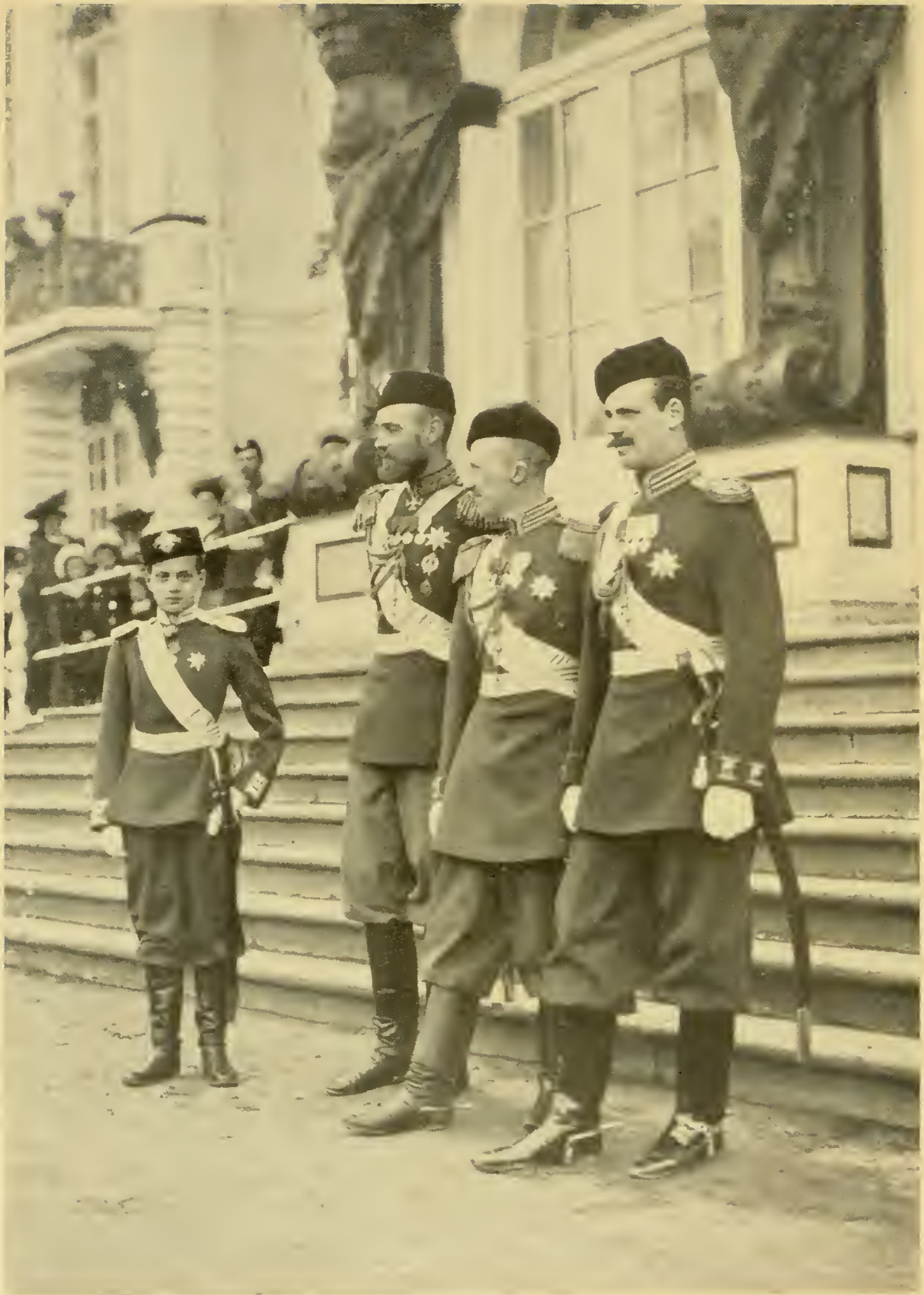
Слѣва направо: Шефъ л. гв. 2-го стрѣлковаго баталіона Великій Князь Дмитрій Павловичъ, Великій Князь Сергѣй Михайловичъ, Принцъ Петръ Александровичъ Ольденбургскій и Великій Князь Михаилъ Александровичъ—на фонѣ Екатерининскаго дворца въ Царскомъ Селѣ. 1906—7 г.г.