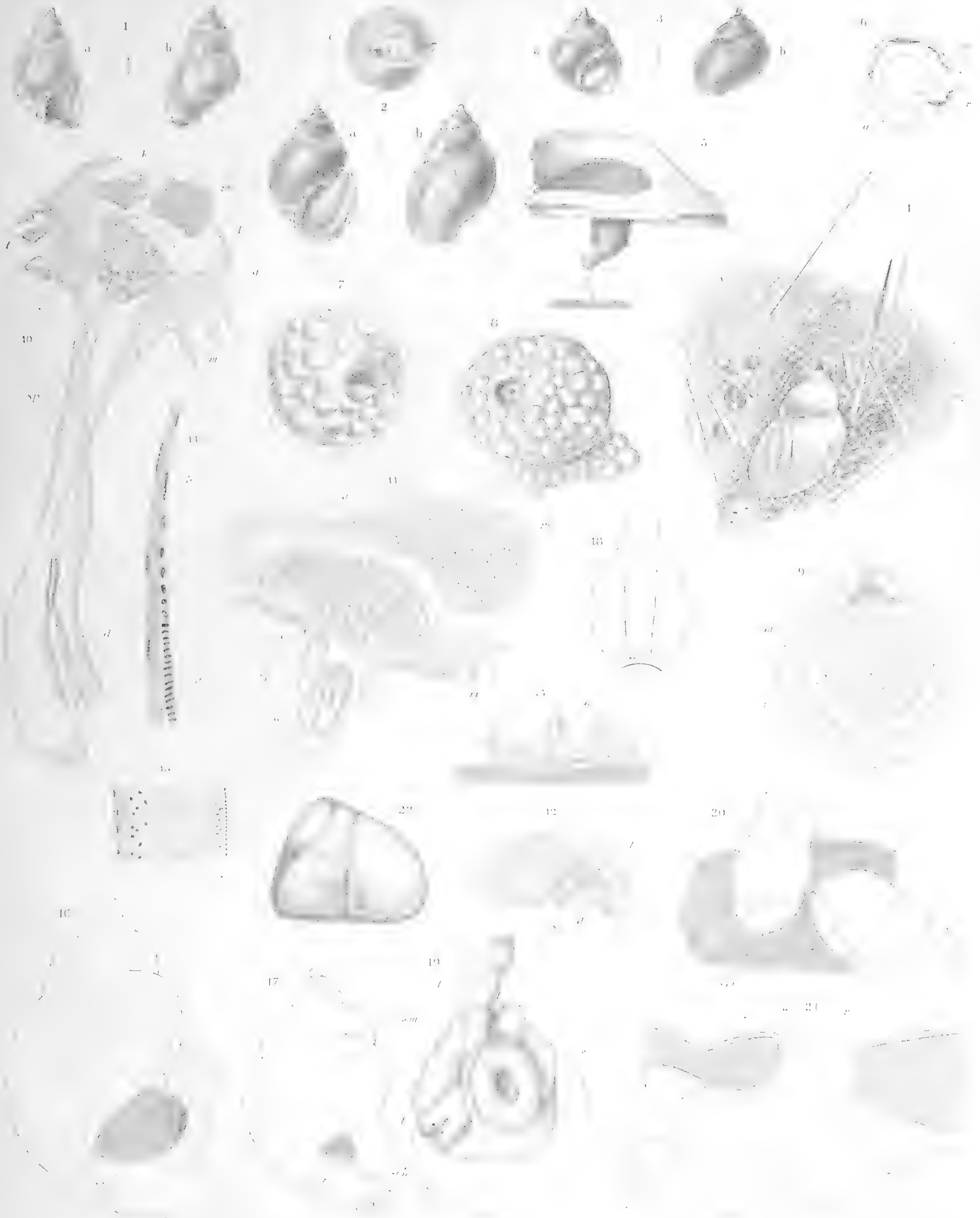
Fig. 1—3 H. W. de Graaf, fig. 4 J. P. Trijs, cet. H. F. Nierstrasz del.