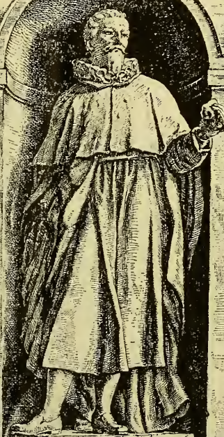
1545 GASPAR TALLACOTIUS 1599

COLLEGE OF PHYSICIANS AND SURGEONS COLUMBIA UNIVERSITY