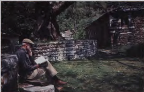
Edward Clark Crossett Professor of Humanistic Studies, Stanford University, 1977-1990