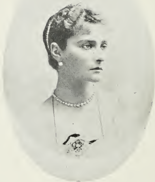
Государыня Императрица Александра Федоровна