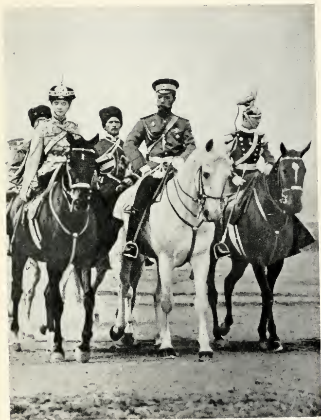
Императоръ Николай II и Великія Княжны Ольга Николаевна и Татьяна Николаевна