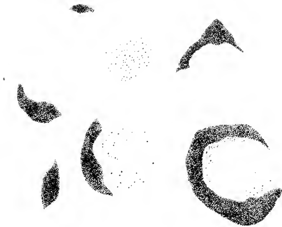
Fig. III. — Cellules du ganglion spinal d'un cheval âgé de 12 ans. — Objectif 6 Staniassie. — Chambre claire de Leitz. — Planche à dessiner au niveau de la préparation. — Coloration à la safranine-picro-nigrosine.