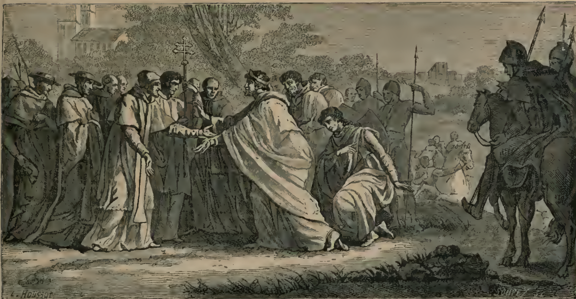
Philippi I, et filii ejus Ludovici, Regis assignati, cum Paschali II Papa colloquium ad S. Dionysium an. mcvii.