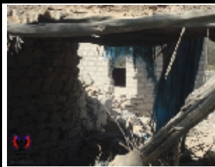
قرية ثعوبة بمديرية مودية ابين التي قصفت من قبل الطيران اليمني وتسبب القصف حينها بمقتل شخص وإصابة عدد اخر من نساء القرية