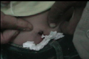
الجنوب العربي وهنا صورة للطفل المذكور اعلاه توضح اصابة اخرى في البطن