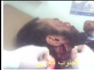
صور القتلى والجرحي الذين سقطوا خلال القصف على مدينة الضالع في يوم الاثنين الموافق 07.06.2010