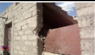
اثار القصف العشوائي على منازل المواطنين