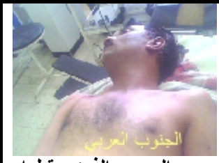
صورالجرحي الذين سقطوا خلال القصف على مدينة الضالع في يوم الاثنين الموافق 07.06.2010