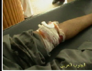
احد الجرحى اصيب بطلق نارى من قبل قوات الامن اثناء مشاركته في مظاهرة سلمية