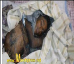
الطفلين الذين لقي مصرعهما يوم 14 مايو 2010 اثر القصف على مدينة جول الريدة بميعة. م/شبووة