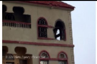
آثار القصف العشوائي على منازل المواطنين في مدينة لودر بمحافظة أبين بتاريخ 20.08.2010