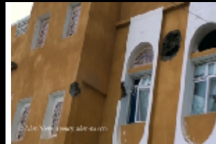
آثار القصف العشوائي على منازل المواطنين في مدينة لودر بمحافظة أبين بتاريخ 20.08.2010