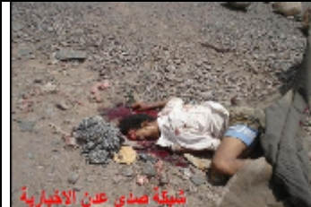
صورة لأحد المتوفين الذين تم دهسهم من قبل سيارة تابعة للقوات اليمنية يوم 30 مايو 2010م