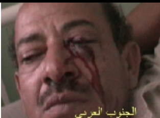
الجنوب العربي صورة لأحد الجرحى الذين اصيبوا في المظاهرة السلمية ليوم الاسير الجنوبي 03.06.2010