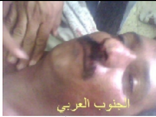
صورالجرحي الذين سقطوا خلال القصف على مدينة الضالع في يوم الاثنين الموافق 07.06.2010