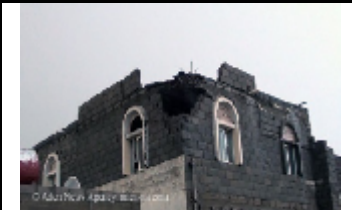
آثار القصف العشوائي على منازل المواطنين في مدينة لودر بمحافظة أبين بتاريخ 20.08.2010