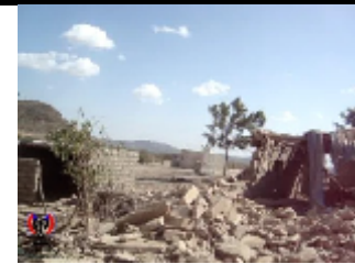
صور للاضرار التي خلفها القصف الجوي الذي استهدف قرية ثعوبة مودية ابين التي قصفت من قبل الطيران اليمني وتسبب القصف حينها بمقتل شخص وإصابة عدد اخر من نساء القرية