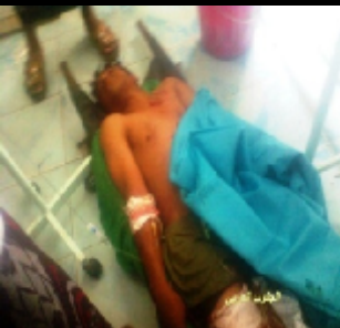
احد الجرحى الذين اصيبوا جراء القصف العشوائي على سوق القات في مدينة الضالع