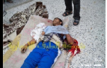
صور احد القتلى الذين سقطوا اثناء القصف على مدينة الضالع في يوم 20 يونيو 2010