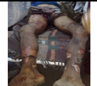
احد ضحايا القصف العشوائي على مدينة الحبييلين