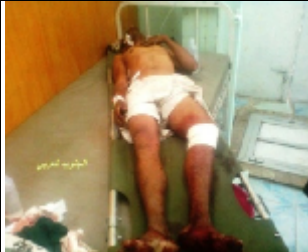
احد الجرحى الذين اصابوا جراء القصف العشوائي على سوق القات في مدينة الضالع