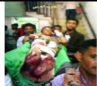
احد الجرحى الذين اصيبوا جراء القصف العشوائي على سوق القات في مدينة الضالع