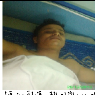
اصيب اثناء القى قنبلة من قبل قوات الامن اليمنية في حي الحجرات بمدينة الضالع