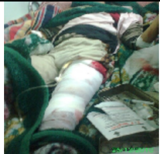
اصيب اثناء القى قنبلة من قبل قوات الامن اليمنية في حي الحجرات بمدينة الضالع