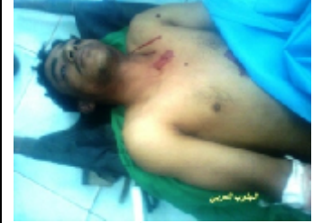
احد الجرحى الذين اصابوا جراء القصف العشوائي على سوق القات في مدينة الضالع