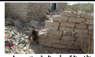
اثار القصف العشوائي على منازل المواطنين