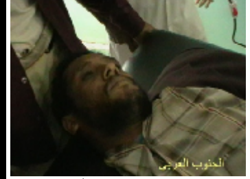
احد الجرحى اصيب بطلق نارى من قبل قوات الامن اثناء مشاركته في مظاهرة سلمية