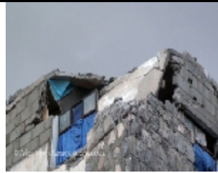
آثار القصف العشوائي على منازل المواطنين في مدينة لودر بمحافظة أبين بتاريخ 20.08.2010