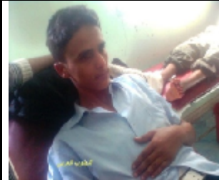
احد الجرحى الذين اصابوا جراء القصف العشوائي على سوق القات في مدينة الضال