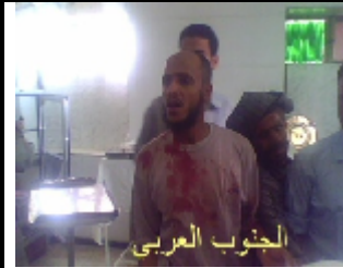
صورالجرحي الذين سقطوا خلال القصف على مدينة الضالع في يوم الاثنين الموافق 07.06.2010