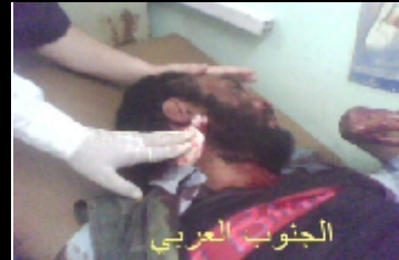
صور القتلى والجرحي الذين سقطوا خلال القصف على مدينة الضالع في يوم الاثنين الموافق 07.06.2010