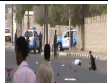
صور الجرحى واحدهم يستنجد بجندي امن يماني الذي يرفض نجدته دون تقديم يد العون له صباح اليوم الأربعاء 07- يوليو-2010 في خور مكسر