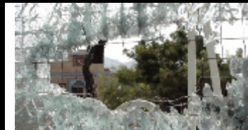
اثار القصف على منزل الشهيد داوود محسن الصهبي