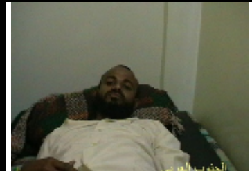
احد الجرحى اصيب بطلق نارى من قبل قوات الامن اثناء مشاركته في مظاهرة سلمية