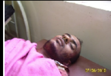
صورة احد القتلى الذين سقطوا خلال القصف على مدينة الضالع في يوم الاثنين الموافق 07.06.2010