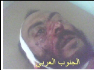
صور القتلى والجرحي الذين سقطوا خلال القصف على مدينة الضالع في يوم الاثنين الموافق 07.06.2010