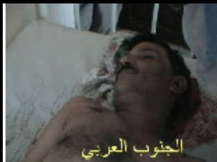
صورالجرحي الذين سقطوا خلال القصف على مدينة الضالع في يوم الاثنين الموافق 07.06.2010