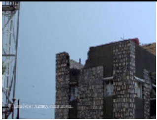
آثار القصف العشوائي على منازل المواطنين في مدينة لودر بمحافظة أبين بتاريخ 20.08.2010