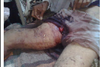
احد ضحايا القصف العشوائي على مدينة الحبيلين