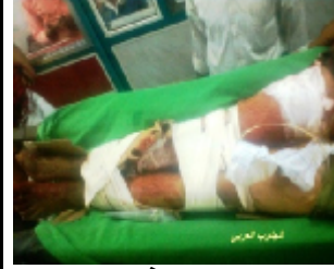
احد الجرحى الذين اصابوا جراء القصف العشوائي على سوق القات في مدينة الضالع