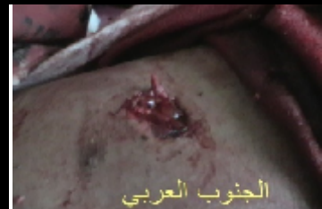
صورة لاجد الجرحى الذين اصيبوا في المظاهرة السلمية ليوم الاسير الجنوبي