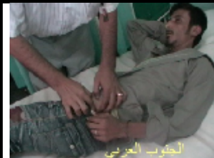
الجنوب العربي صورة لأحد الجرحى الذين اصيبوا في المظاهرة السلمية ليوم الاسير الجنوبي 03.06.2010