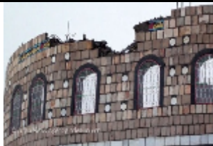
آثار القصف العشوائي على منازل المواطنين في مدينة لودر بمحافظة أبين بتاريخ 20.08.2010