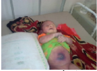
الطفل فارس عبدالمجيد اثناء القصف العشوائي على مدينة الحبيلين يوم مايو 2010م 30 توفي متأثراً بشظايا قذائف مدفعية سقطت على أحياء المدينة