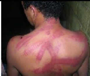
آثار التعذيب على احد نشطاء الحراك الجنوبي السلمي في حضرموت خلال اجتازه بسجن الامن السياسي بسيون