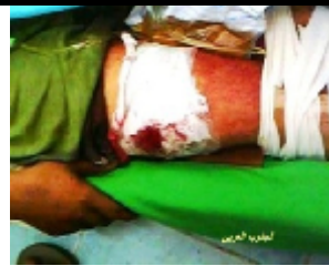
احد الجرحى الذين اصيبوا جراء القصف العشوائي على سوق القات في مدينة الضالع