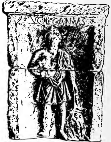
AUTEL GALLO-ROMAIN DE NOTRE-DAME DE PARIS