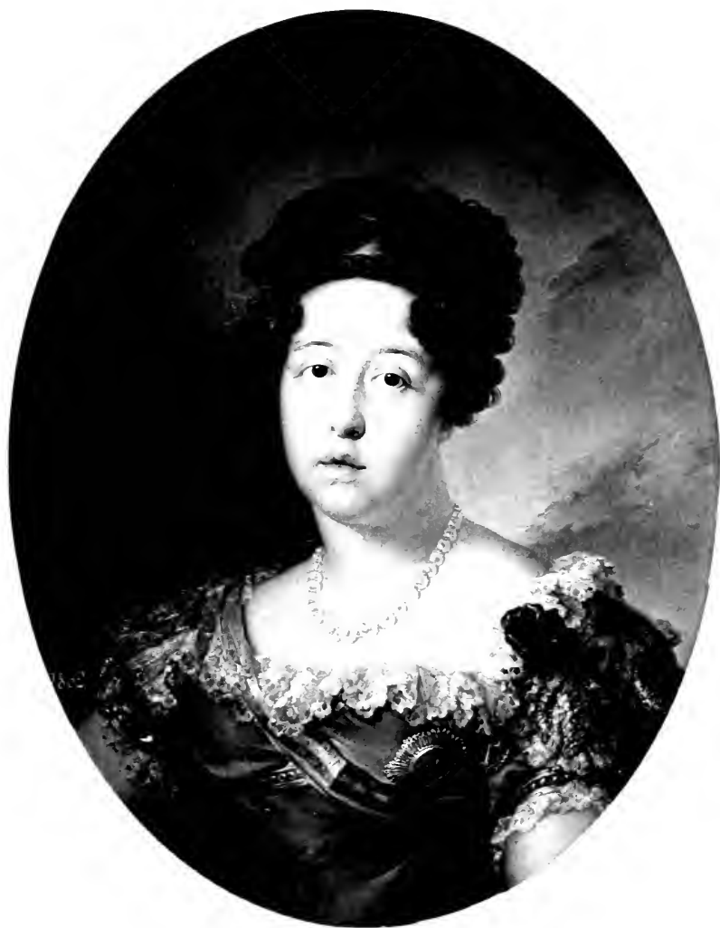
Vicente Lopez y Portaña REINA ISABEL DE BRAGANZA