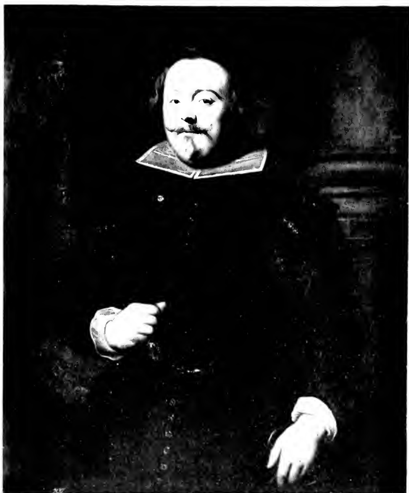
FRANCISCO DE MONCADA