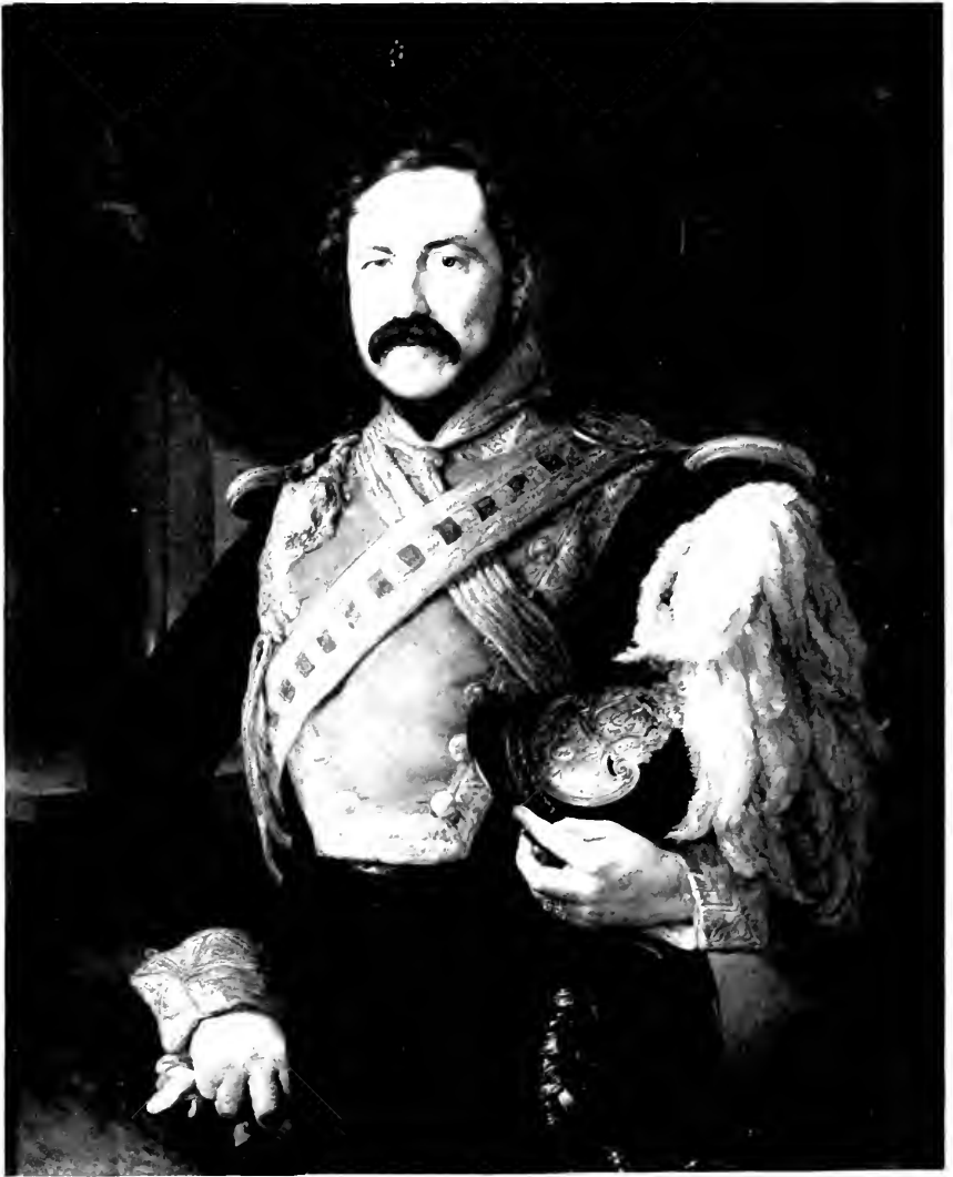
GENERAL [Name] [Rank]