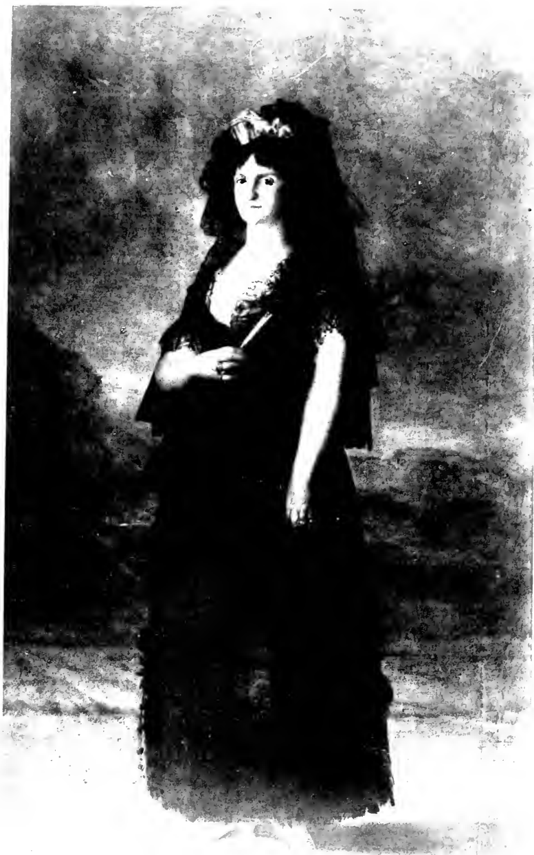
REINA MARIA LUISA DE PARMA