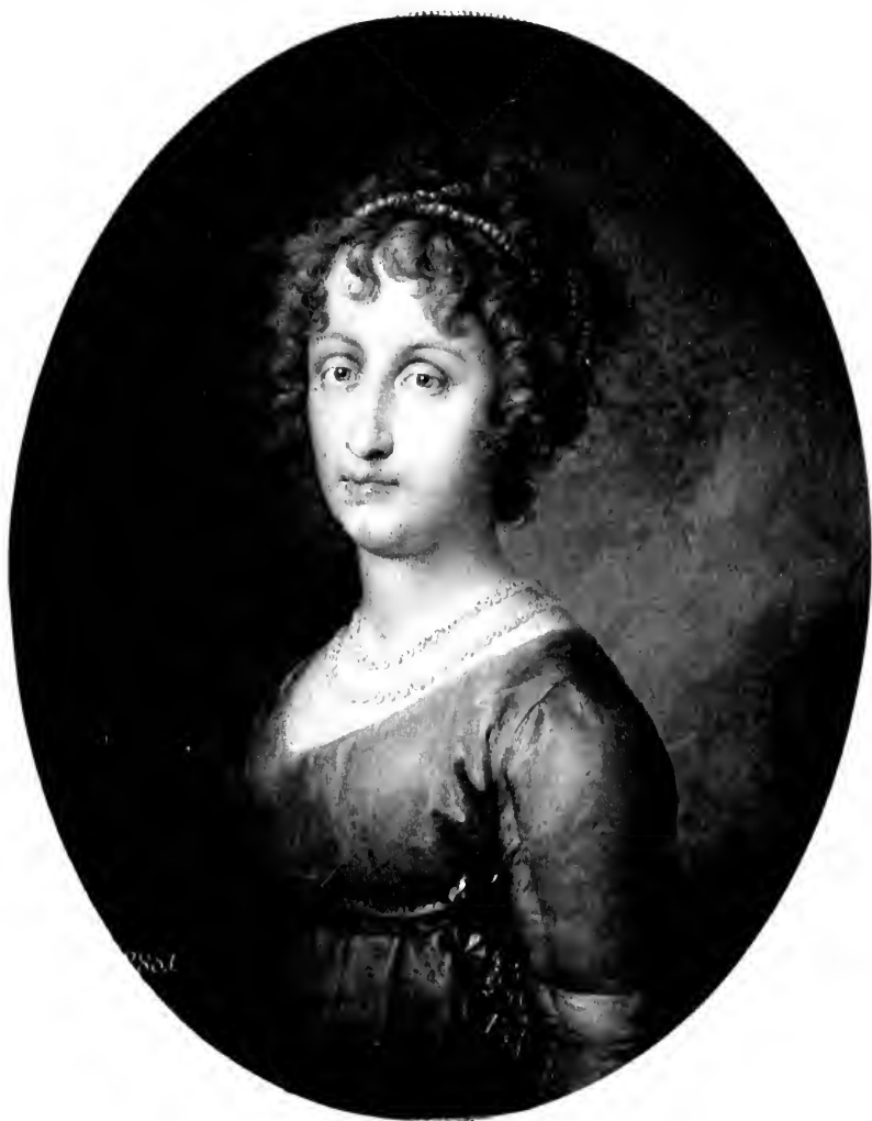
Vicente Lopez y Portaña PRINCESA MARIA ANTONIA