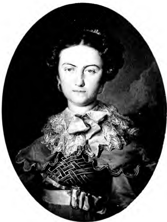
Vicente López y Portaña REINA MARIA JOSEFA AMALIA