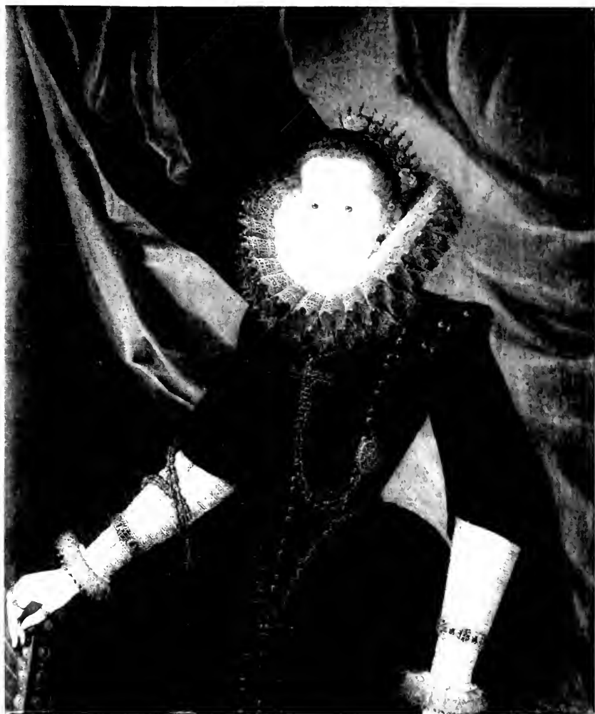
Juan Pantoja de la Cruz REINA MARGARITA DE AUSTRIA