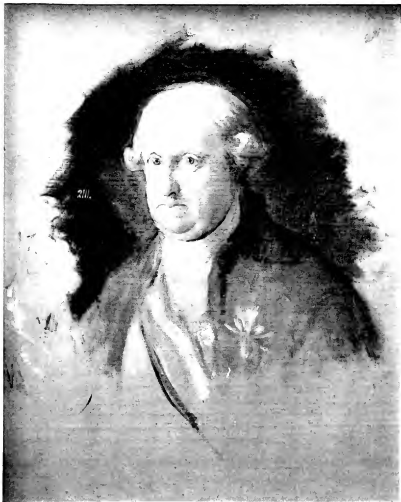
Goya SANTE D. ANTONIO