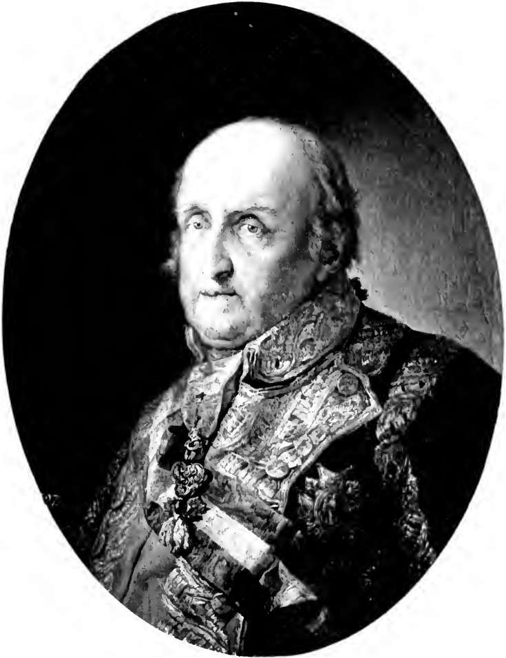
Vicente Lopez y Portaña INFANTE DON ANTONIO