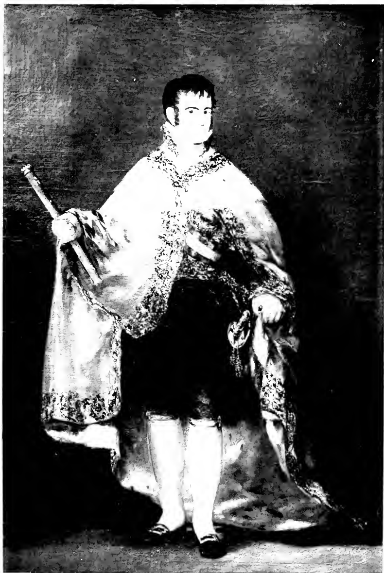
Prinza FERDINANDO VII 60