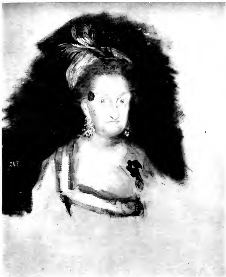
Goya INFANTA MARIA JOSEFA 62