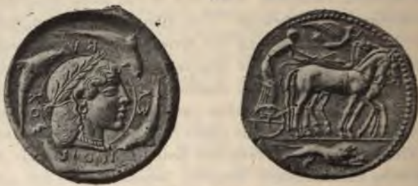
Abb. 3. Damareteion. \frac{1}{1} .

Damareteia in den schönen syrakusanischen Zehndrachmenstücken mit dem Korakopf widererkennen wollen 1 . Obwohl er damit die allein in Frage kommende Sorte richtig getroffen hat, irrt er doch insofern, als die von ihm bezeichneten Stücke zwei Menschenalter jünger sind als die Damareteia. Gleich darauf erwarb der Duc de Luynes eines jener seltenen syrakusanischen Zehndrachmenstücke, die der Uebergangszeit vom archaischen zum freien Stil angehören und auf der Vorderseite den von Delphinen umgebenen Kopf der als Nymphe gedachten Stadtgöttin in dem ganzen intimen Reiz der genannten Kunstrichtung tragen, während die Rückseite ein Viergespann aufweist, das vom Lenker mit Aufbietung seiner ganzen Kraft im Schritte gehalten und von der schwebenden Nike mit dem Siegeskranze ausgezeichnet wird (Abb. 3) 2 . Von dieser Münze lassen sich zur Zeit acht