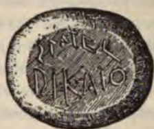
Abb. 4 Kalkstein. 1 / 1 .