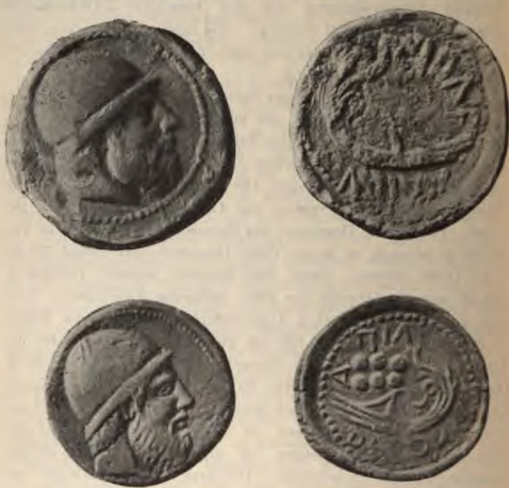
Abb. 5. Lipara. Litra und Hemilitrion des schweren Fusses. \frac{1}{4}

zurück 1 . Früher rechnete man auf das Talent 12 Tetradrachmen, während Dionys seinen Werth auf 12 Nomoi oder Pegasosstateren beschränkte. Auf die Gründe, die diese Maassregel veranlasst haben, kann ich hier nicht näher eingehen. Aber klar ist, dass dadurch niemand geschädigt wurde. Die Nachrichten über die betrügerischen Manipulationen, die der Tyrann auf dem Gebiete des Münzwesens vorgenommen haben soll, sind lediglich eine absichtliche Entstellung des Wesens und Zweckes der genannten