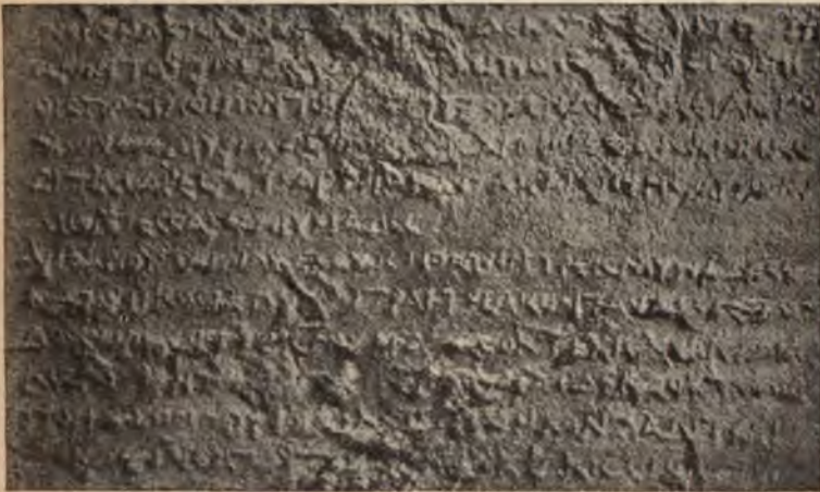
Abb. 2. Ausschnitt aus der Inschrift: Zeile 103—114. \frac{6}{10} .

gabe aller Buchstabenformen musste verzichtet werden. Welche Schwierigkeiten das gemacht hätte, zeigt ein Blick auf die in Abbildung 2 gegebene Probe aus der Inschrift, auf der auch die Neigung des Steinmetzen, viele Buchstaben monogrammartig zusammenzuziehen, stark genug zu Tage tritt. Da die Abbildung nach dem Abklatsche hergestellt ist, so erscheinen hier alle Vertiefungen des Originals erhaben. In den Formen der Buchstaben herrscht eine noch grössere Regellosigkeit als auf den bisher bekannten Steinen. Vom ersten Buchstaben kommen drei Formen vor, meist \Lambda , daneben \text{A} und \text{A} , sonst verdienen Erwähnung \text{E} , \Theta (ob auch \odot war aus den Abklatschen nicht zu ermitteln), \text{F} neben \text{z} , \Pi neben \Pi , \text{C} , \text{T} neben \text{I} , \Omega neben \text{W} ; \text{t} adscriptum kommt