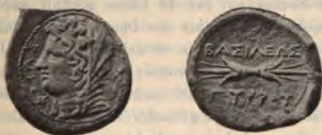
Abb. 6. Litra des Pyrrhos. \frac{1}{1} .

syrakusanische Talent 1637.5 g und seine Litra 13.644 g 2 . Eine Litra von diesen Gewichte fanden wir eben schon in Lipara.