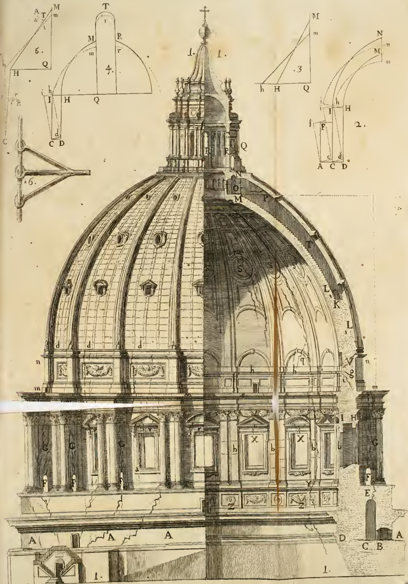
CVPOLA DI S. PIETRO