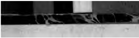
TABLE DES PRINCIPALES MATIÈRES