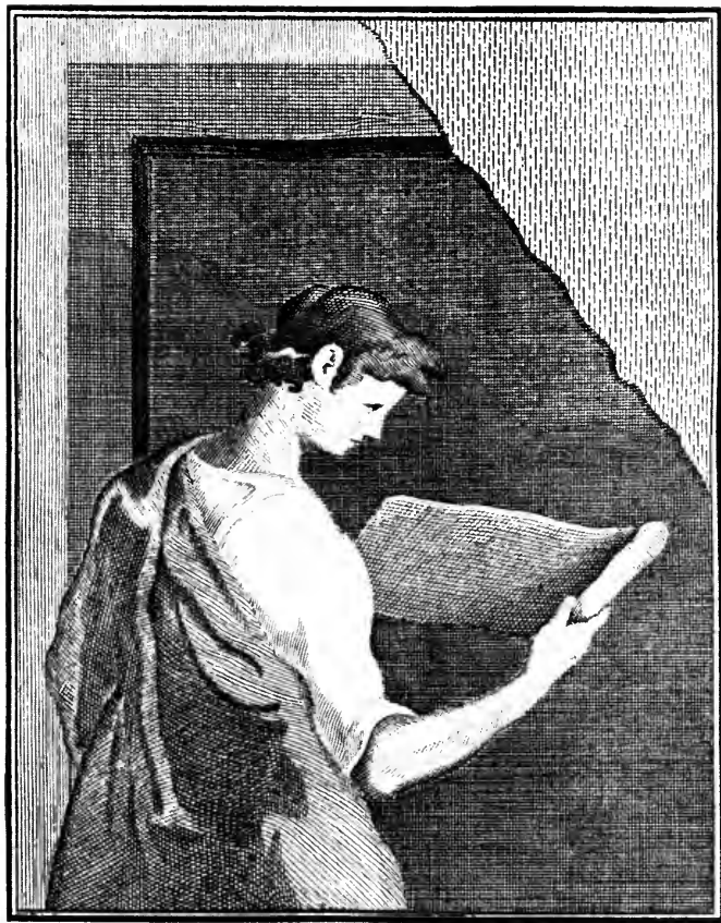
Halsted VanderPoel Campanian Collection