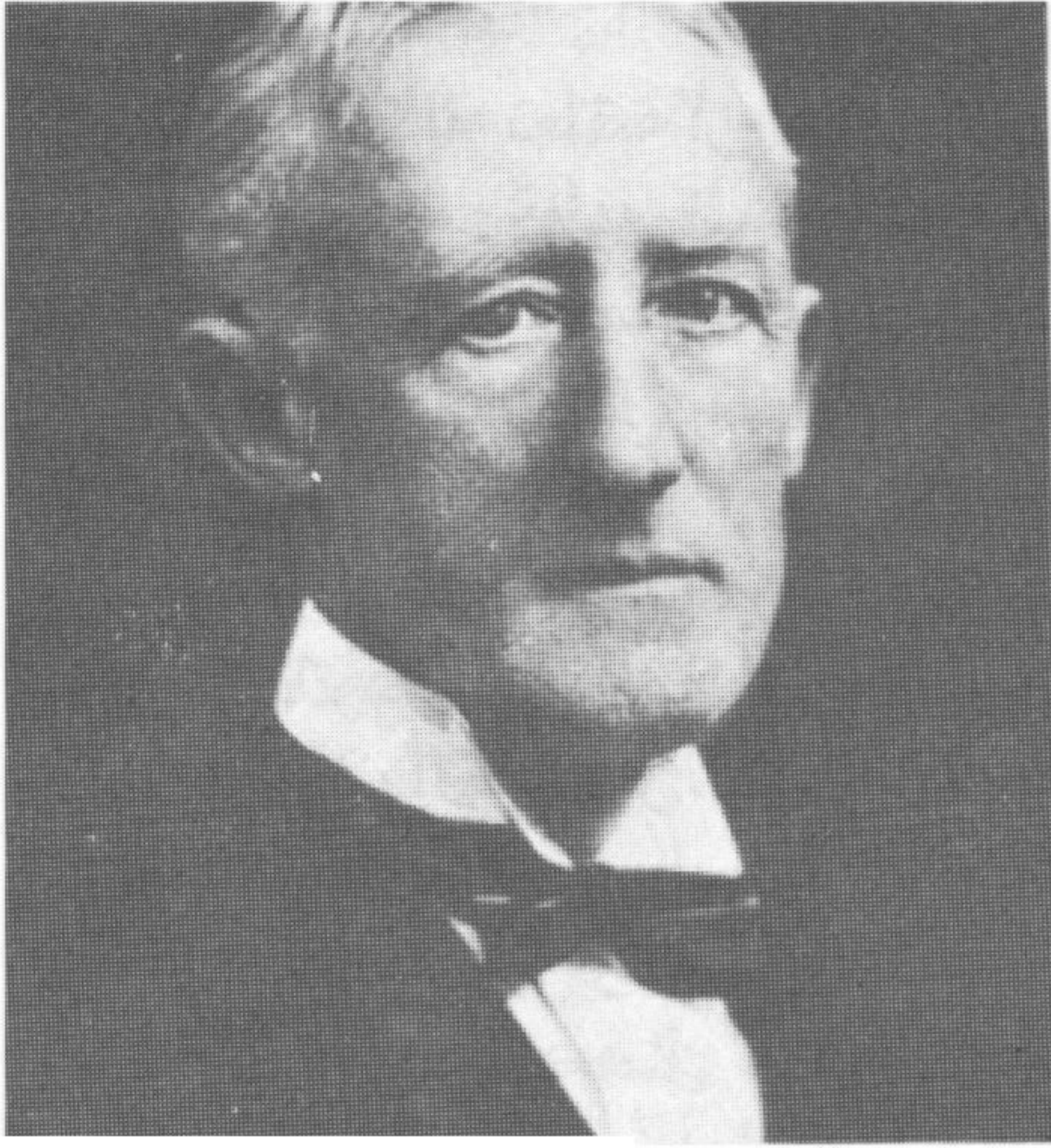
سير برسي كوكس