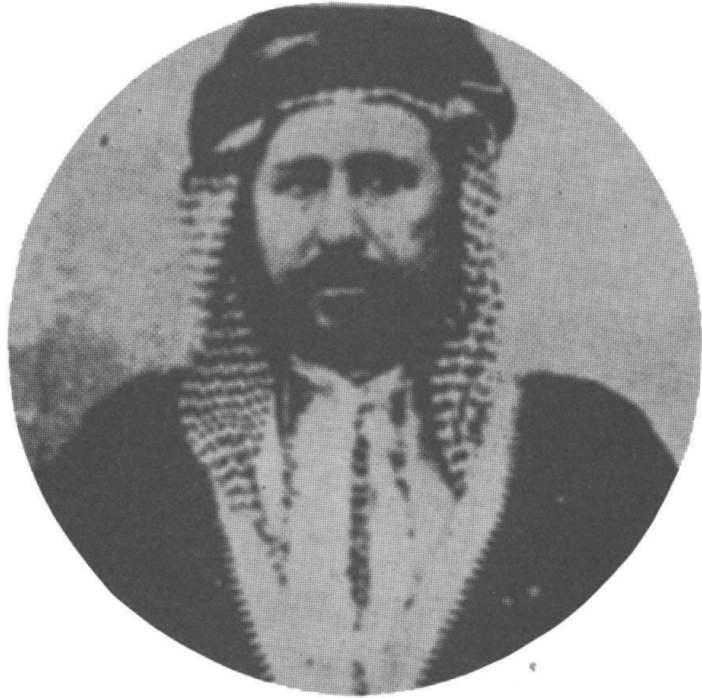
الشيخ خزعل أمير المحمرة