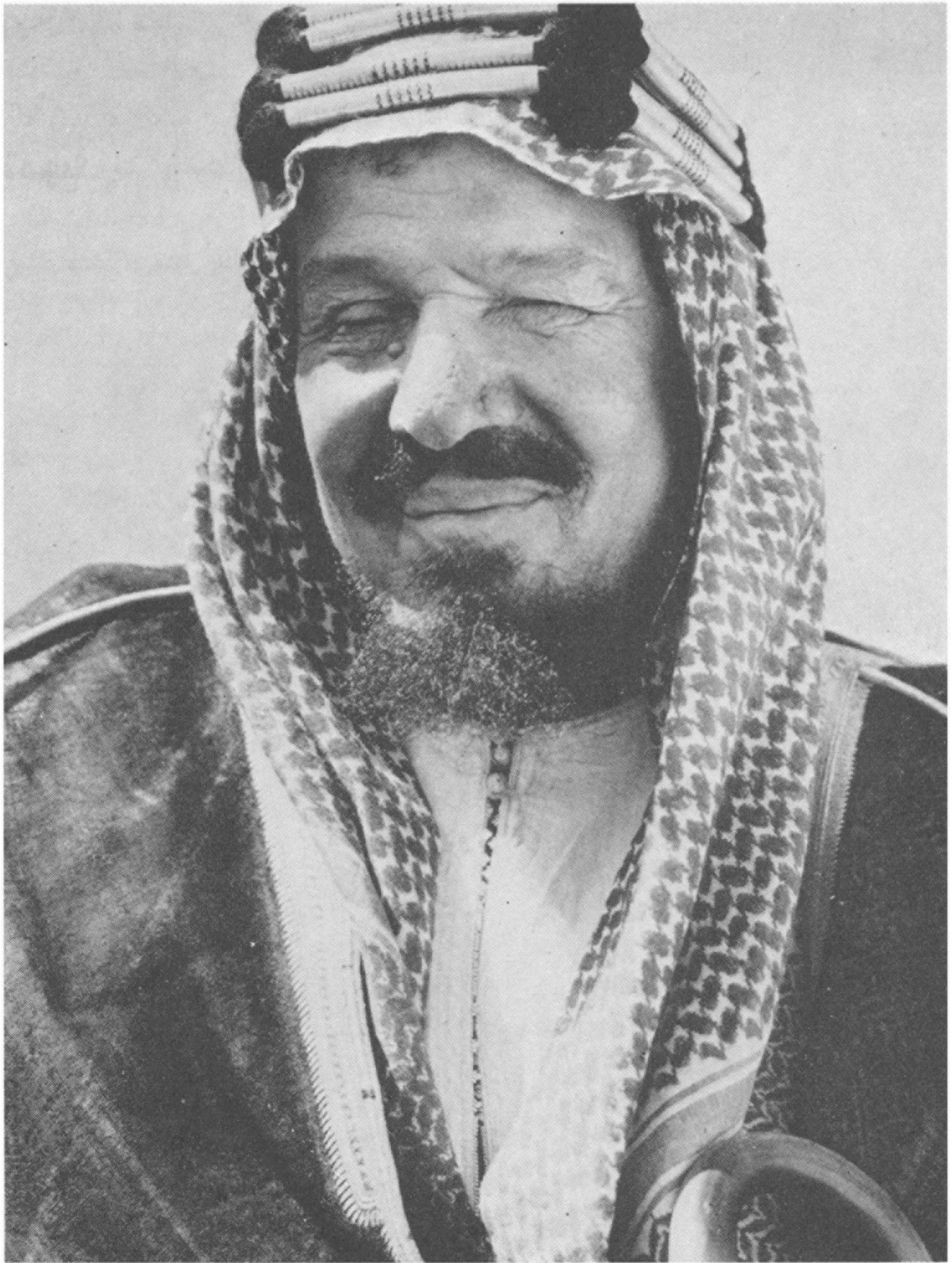
الملك عبد العزيز