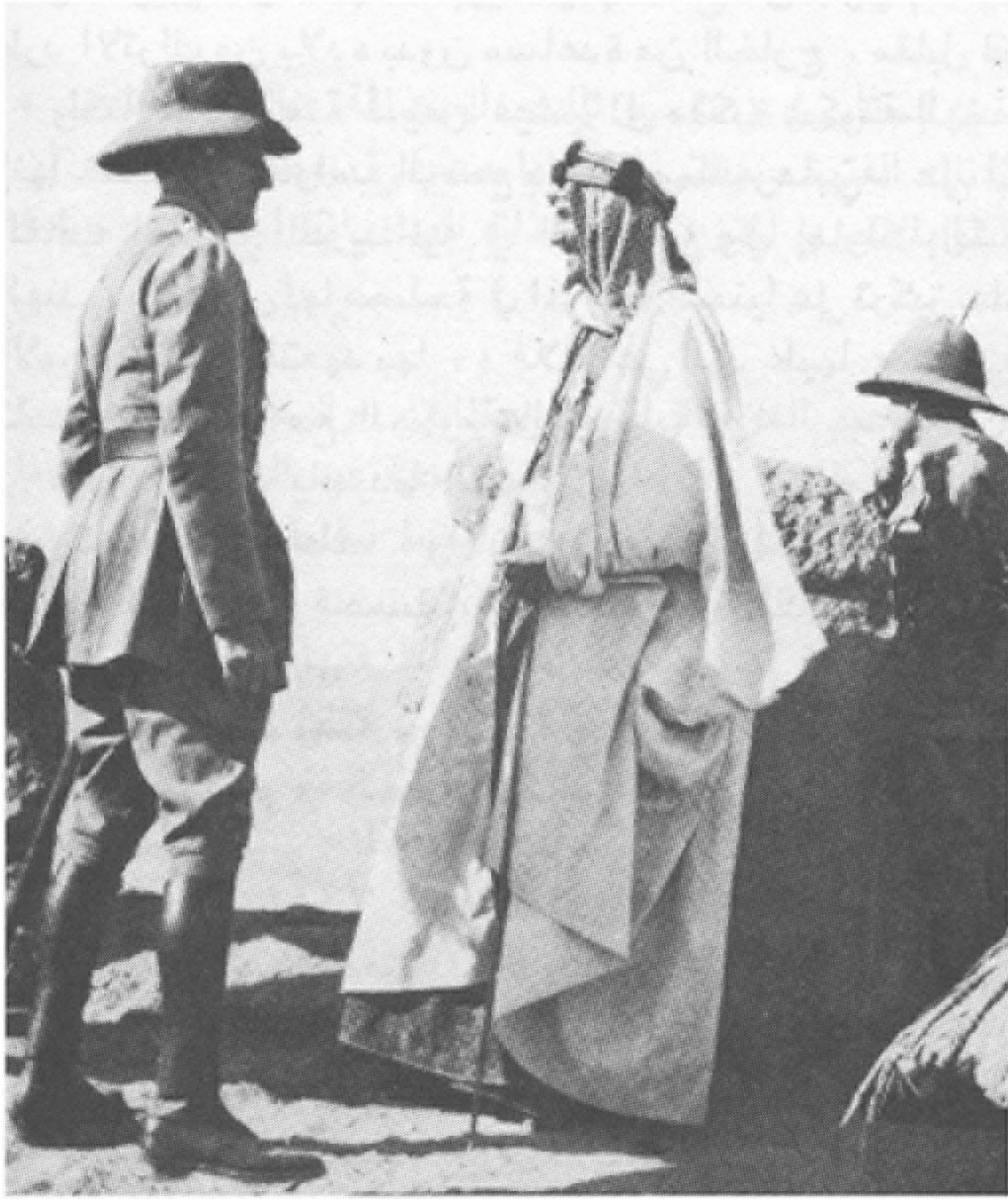
من كوكس الى تشرشل رحلة استغرقت أربعين عاما وحررت ووحدت الجزيرة رغم أنف «صداقة» بريطانيا.