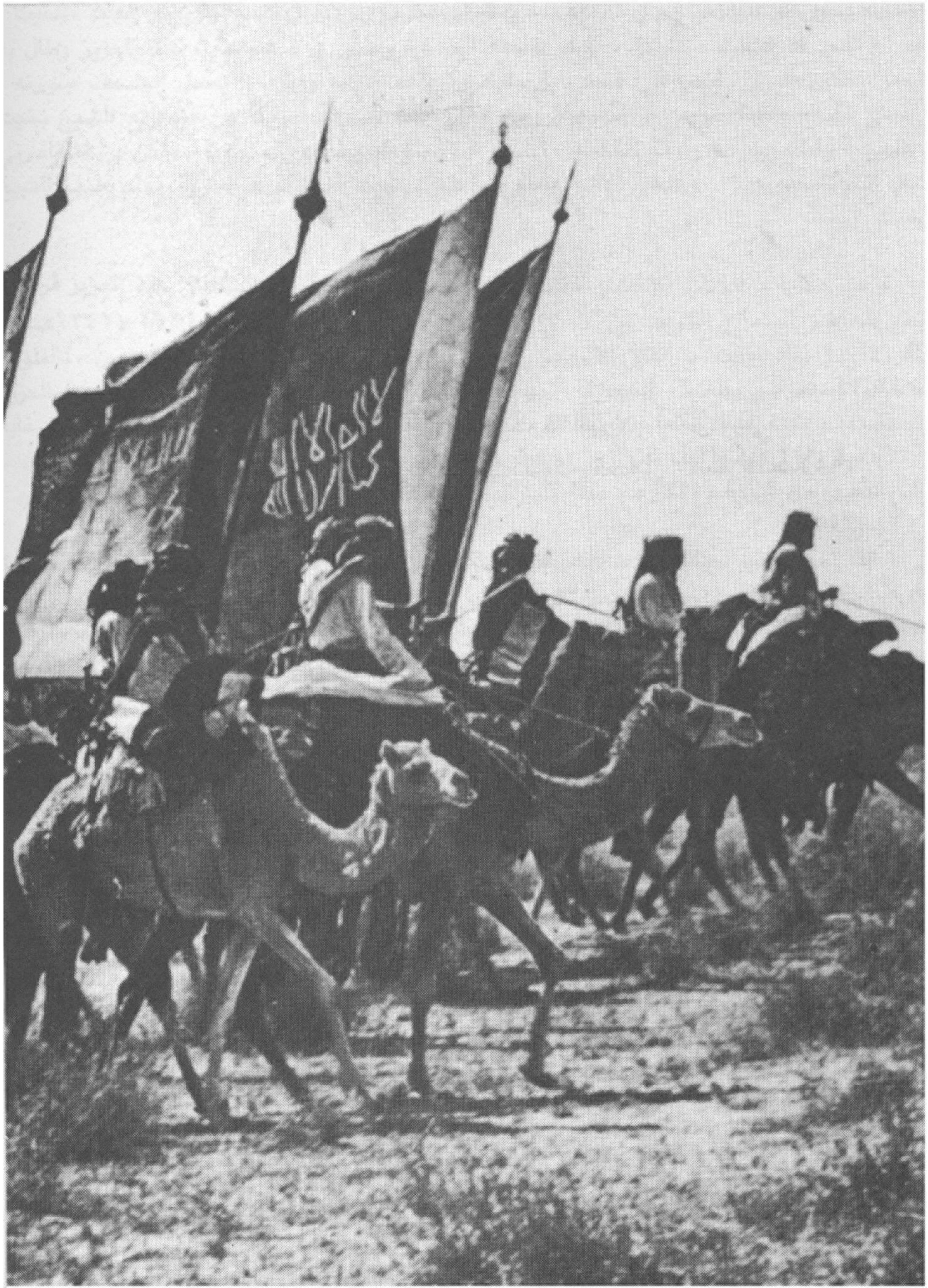
جيش السعوديين : نفس الراية لثلاثة قرون .