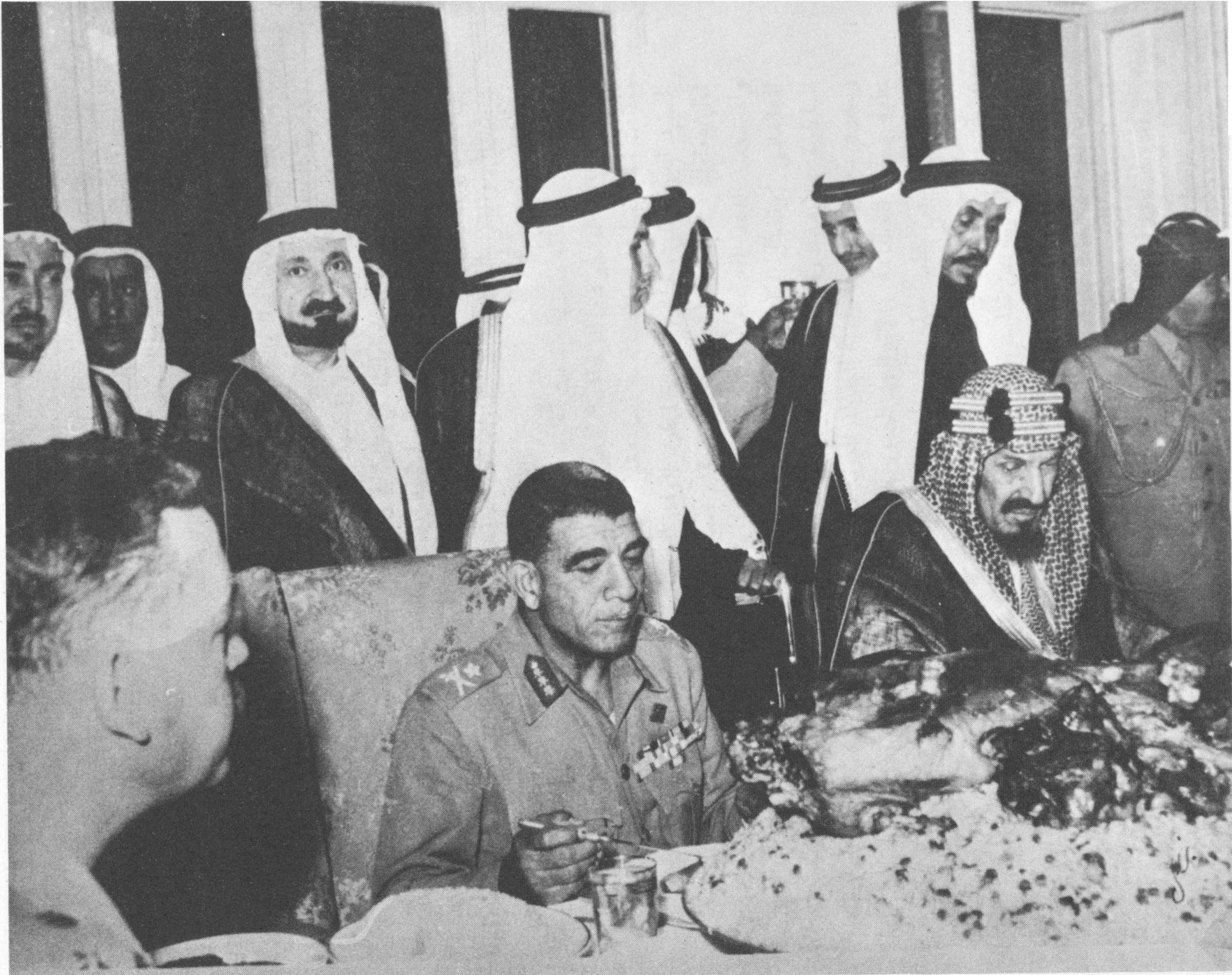
الملك عبدالعزيز مع الرئيس المصري محمد نجيب ويرى الامير سلمان بن عبدالعزيز خلف عبدالرحمن الطبيشي وزير الدولة لشئون المراسم