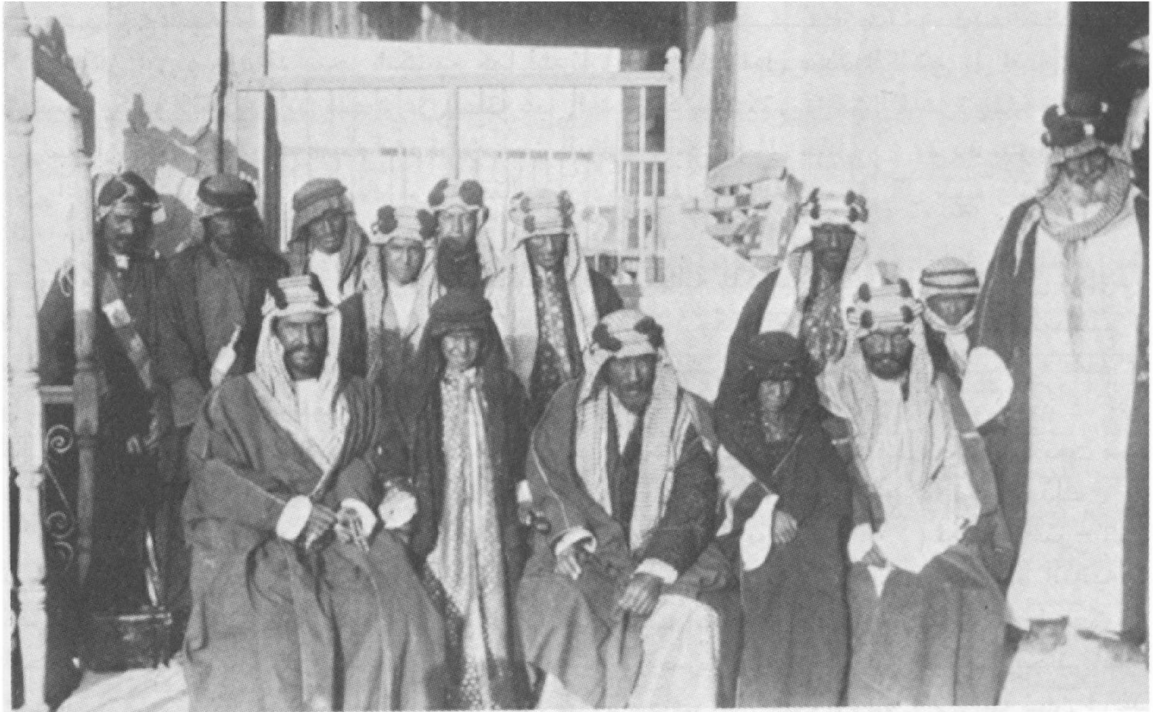
هذه هي الصورة التي استند اليها مؤلف كتاب شكسبير عن لقاء الكويت بين عبد العزيز وشكسبير . وهي من تصوير شكسبير نفسه .