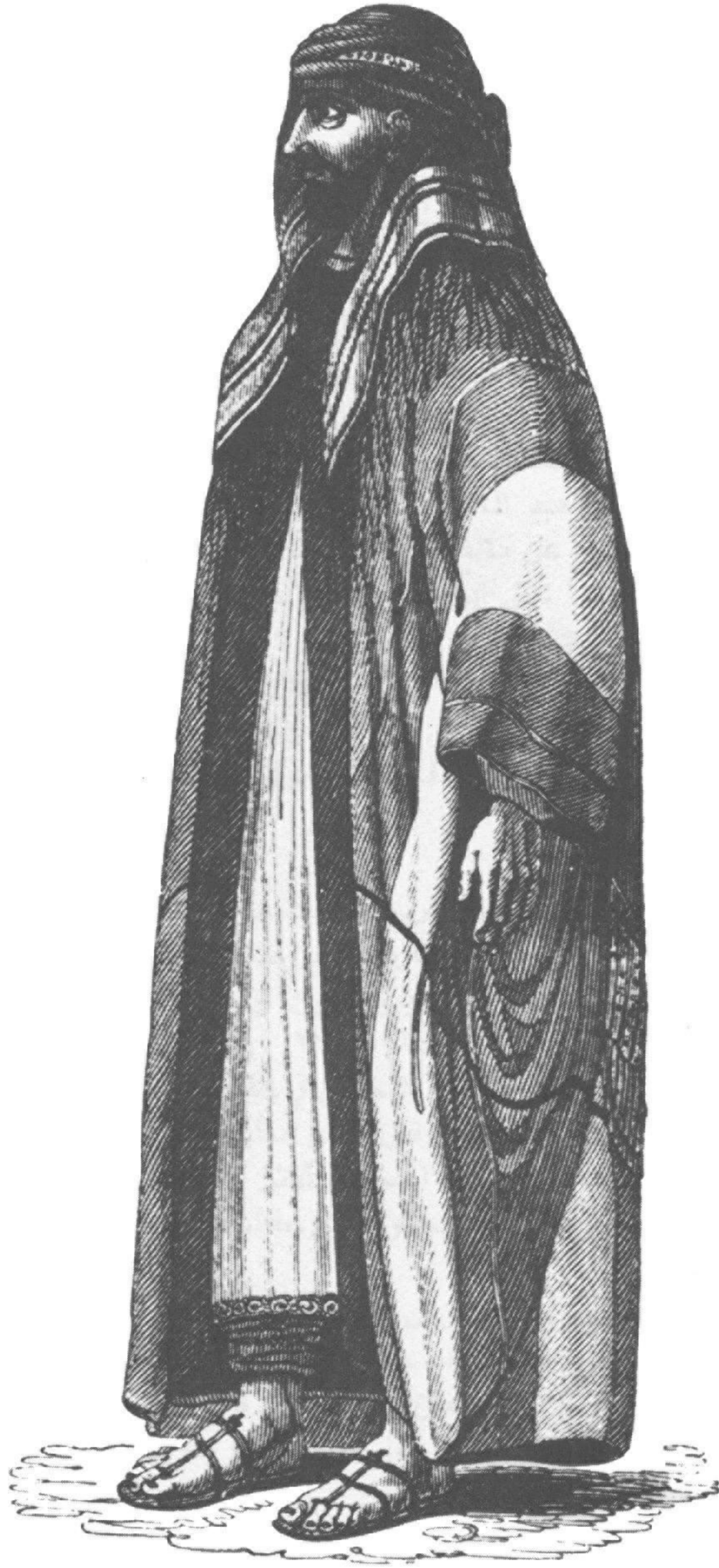
الامام الشهيد عبد الله بن سعود في منقاه .