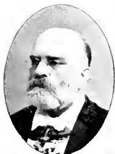
Nils Christofer Dunér.

F. i Hvellinge, Malm. län, 1843 2/6 . Apotekareex. 66. Verkst. direktör för Oskarshammns ensk. banks afd.-kontor i Kalmar 74—86; led. i Styr. o. verkst. direktör för Kalmar ensk. bank 86—95; byråassistent i Finansdep. bankbyrå 95—99; ledamot i Centralstyr. o. verkställande direktör för aktiebolaget Föreningsbanken i Stockholm fr. 1900.