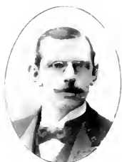
Marcus Laurentius Wallenberg.

F. i Stockholm 1864 5 3. Stud. i Upps. 83; jur. kand. 88. Underlöjtn. vid Flottan 82 o. i Flottans reserv s. år; afsked ur Flottan 93; vice häradsh. 90; ombudsman vid Stockholms ensk. bank s. år; ledamot i Styr. o. vice verkställande direktör därst. fr. 92.