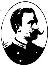
Uno Axel Theodor Bolin.

F. i Stockholm 1859 11/8 . Underlöjtn. vid Gotl. nationalbev. (Gotl. inf.-reg.) 82; löjtn. 89; sjukgymnast i le Hävre 90—97 o. i Sthlm 98—1901; kaptän 1900.