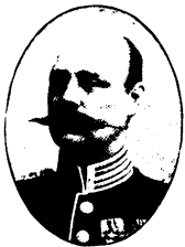
Arvid Mauritz Wester.

F. i Gefle 1855 17/5 . Underlöjtn. vid Gotl. nationalbev. (Gotl. inf.-reg.) 76; löjtn. 82; kapt. 95; major 1903.