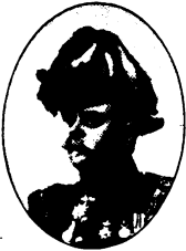
Johan Gustaf Björlin.

Öfverste , med chefs makt o. myndighet, vid Gotl. inf.-reg.; generalmajor . (Se sid. 3).