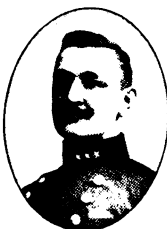
Axel Fredrik Hultkrantz.

F. i Södra Ljunga, Kronob. län, 1866 8 / 10 . Underlöjtn. vid Kronob. reg. 90; löjtn. 95; extra intendent i Int.-kåren 99; intendent af 2:a kl. 1900 o. af 1:a kl. 02 ; adjut. vid Int.-kårens hufvudstation 02—06; sekr. i Utrustningskommissionen fr. 02; reg.-intendent vid Göta lifg. fr. 06.