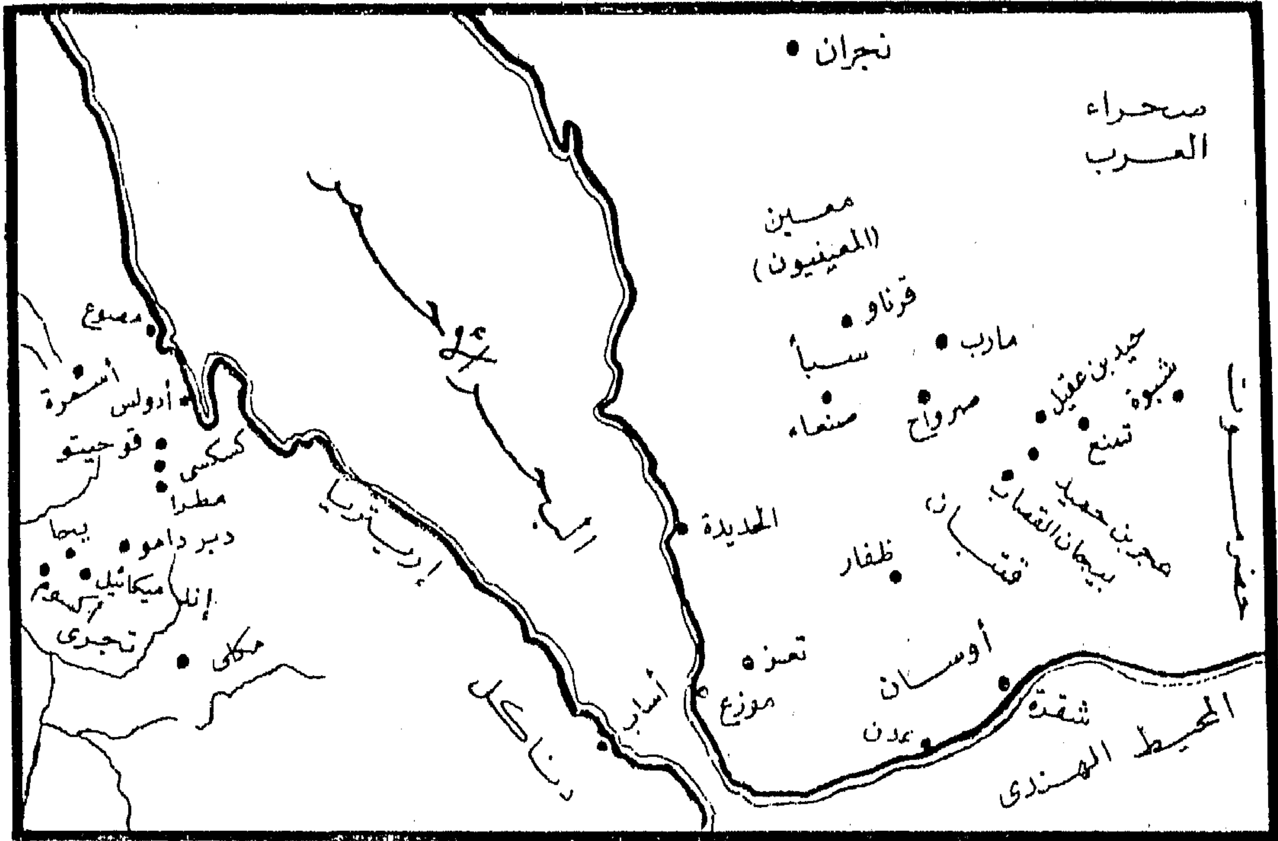
خريطة رقم (٢) اليمن والحيشة مأخوذة من كتاب "الحضارات السامية القديمة" تأليف سبتينو موسكاتي وترجمة يعقوب بكر