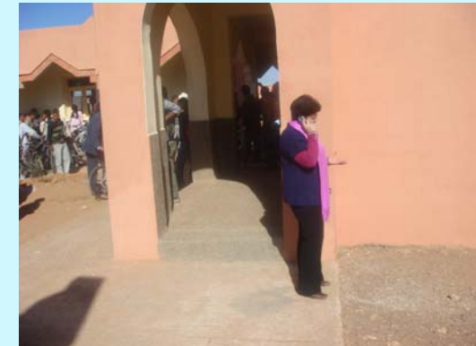
السيدة كاتبة الدولة تعطي تصريحاً صحفياً عبر الهاتف لإحدى القنوات الإذاعية الوطنية