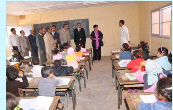
السيدة كاتبة الدولة تطلع على قسم يضم جيل مدرسة النجاح