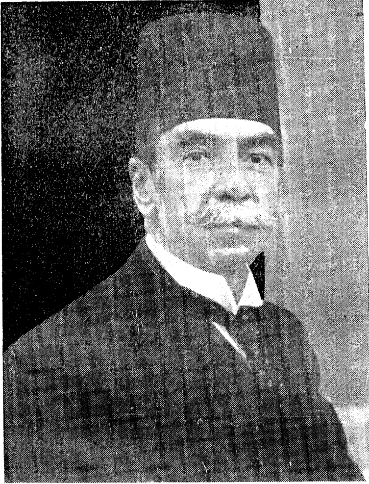
العلامة المحقق المغفور له احمد تيمور بابا شا