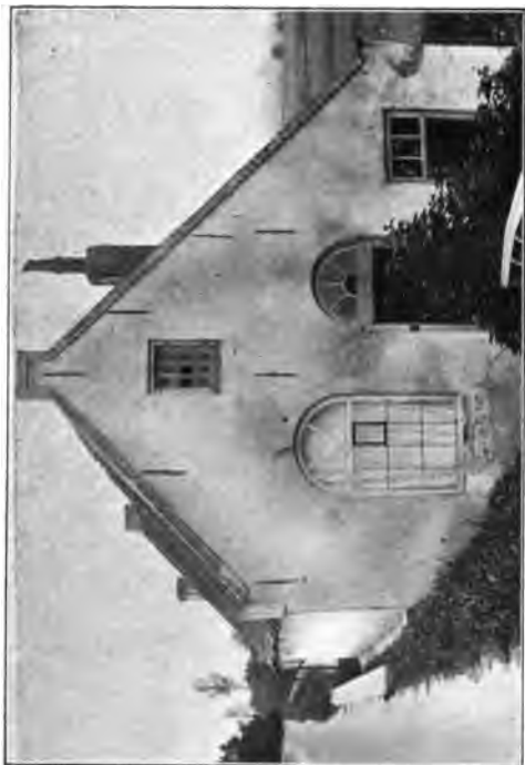
VUREN'S KERKJE MET SCHOUWENBURG'S WOONKAMER.