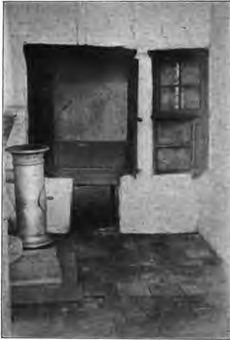
HET INWENDIGE VAN SCHOUWENBURG'S WOON- EN STERFKAMER.