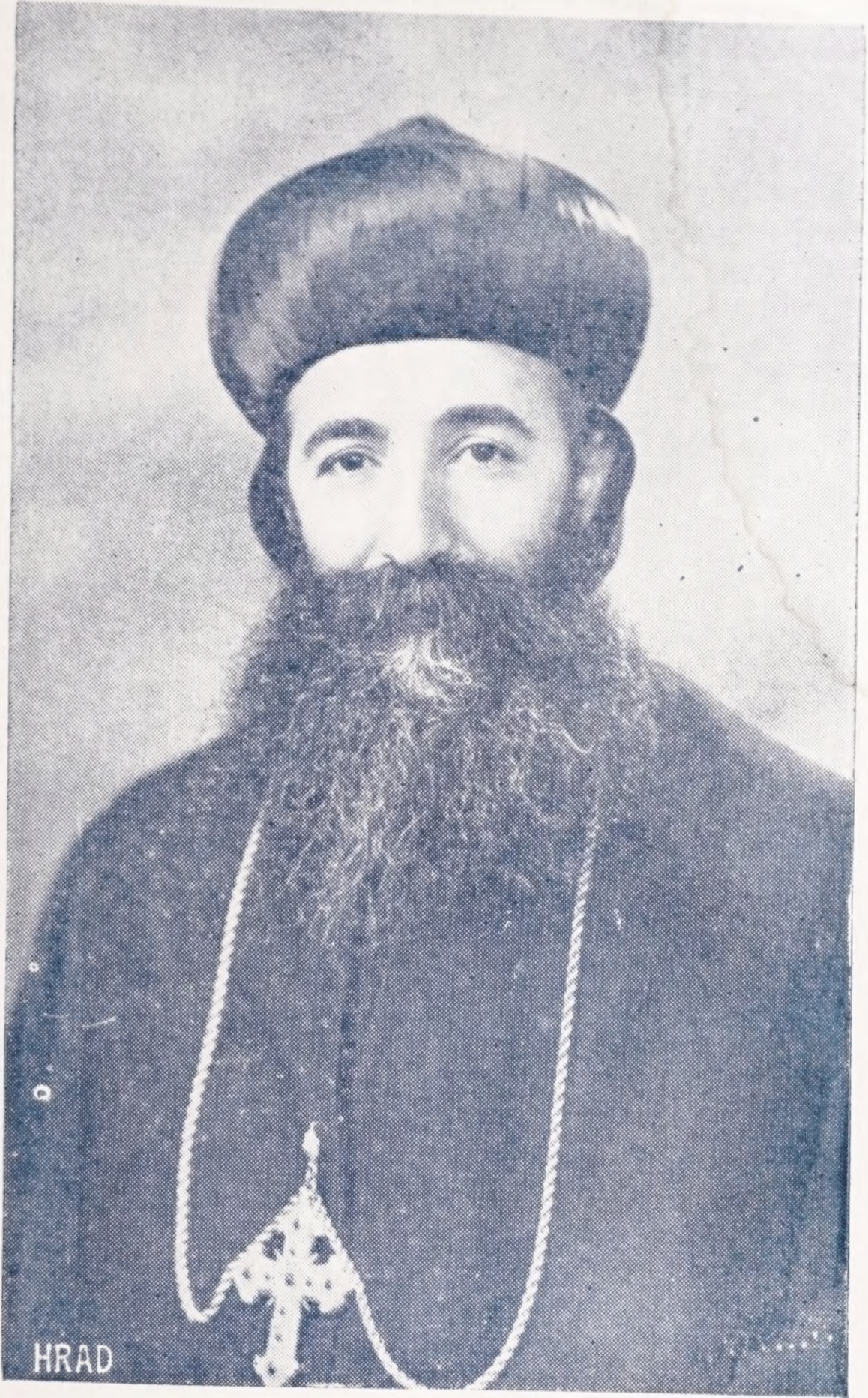
سباوة افسر اطلبيل مايکونو شيوه سر حسن همدان ملران ابرشيه حلب و توابعها للسريان الارثوذکس