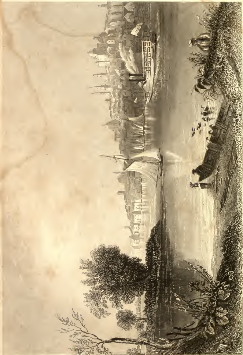
View of the Harbor of the Cape of Good Hope, from the Point of the Table Mountain, August 1840.