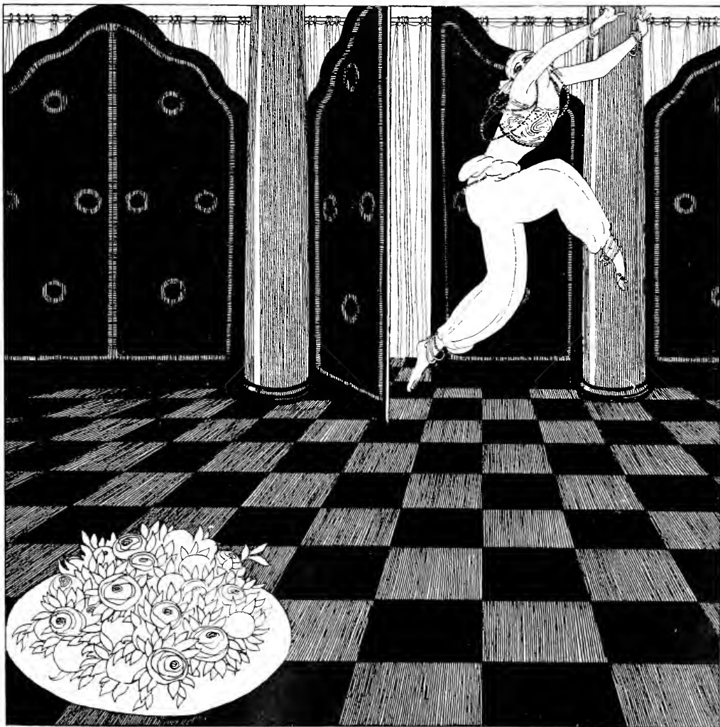
Nègre de la Sultane, il vole en s'échappant,