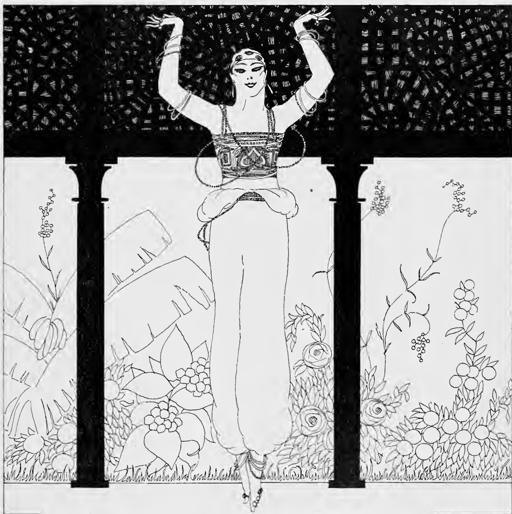
Apollon tient le fil au bout duquel il pend.