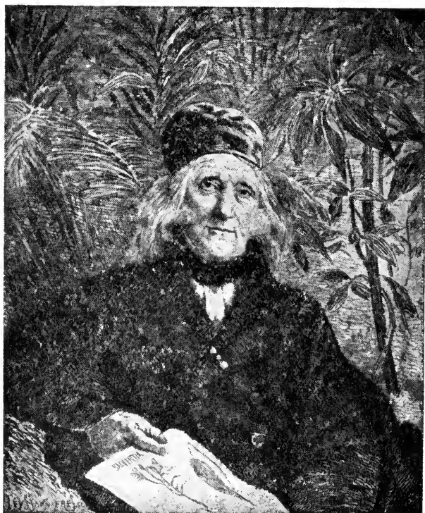
AUGUSTE DE SAINT-HILAIRE (1779-1853)