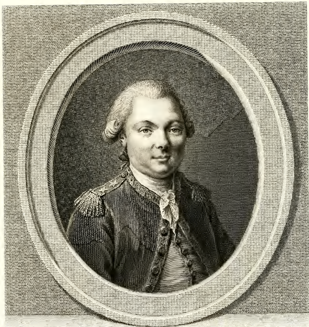
JEAN FRANÇOIS GALAUP DE LA PÉROUSE, Chef d'Escadre des Armées Navales . né à Alby en 1741.