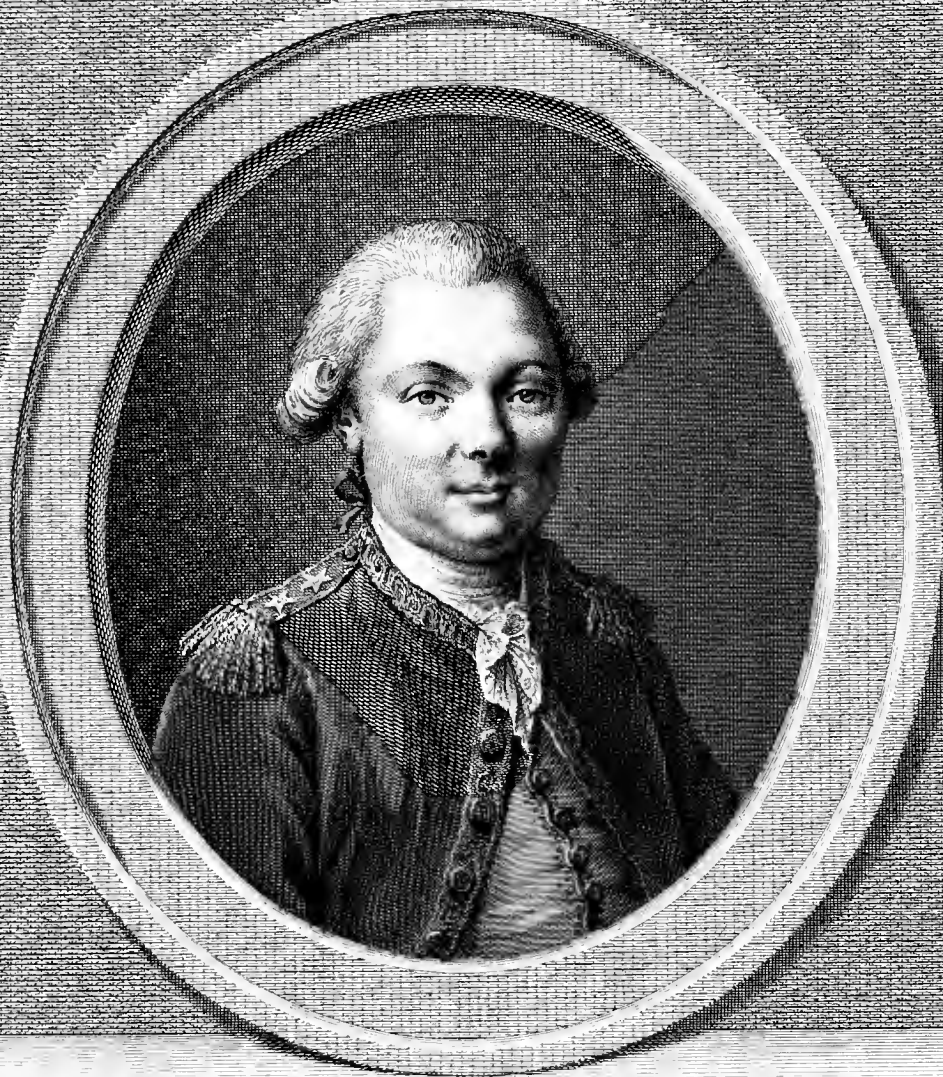
JEAN FRANÇOIS GALAUP DE LA PÉROUSE, Chef d'Escadre des Armées Navales. né à Alby en 1741.