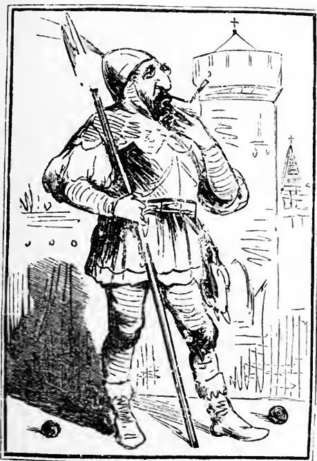
Wipphchen als 1432 jähriger Bernauer Bürger.