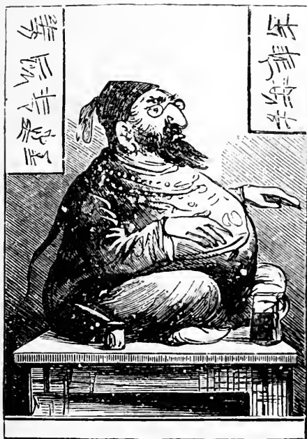
Whippen als himmlischer Reichsbürger.