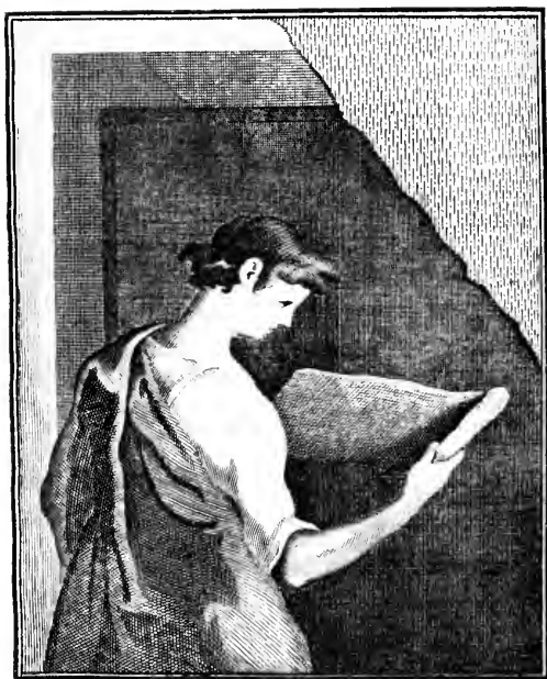
THE J. PAUL GETTY MUSEUM LIBRARY