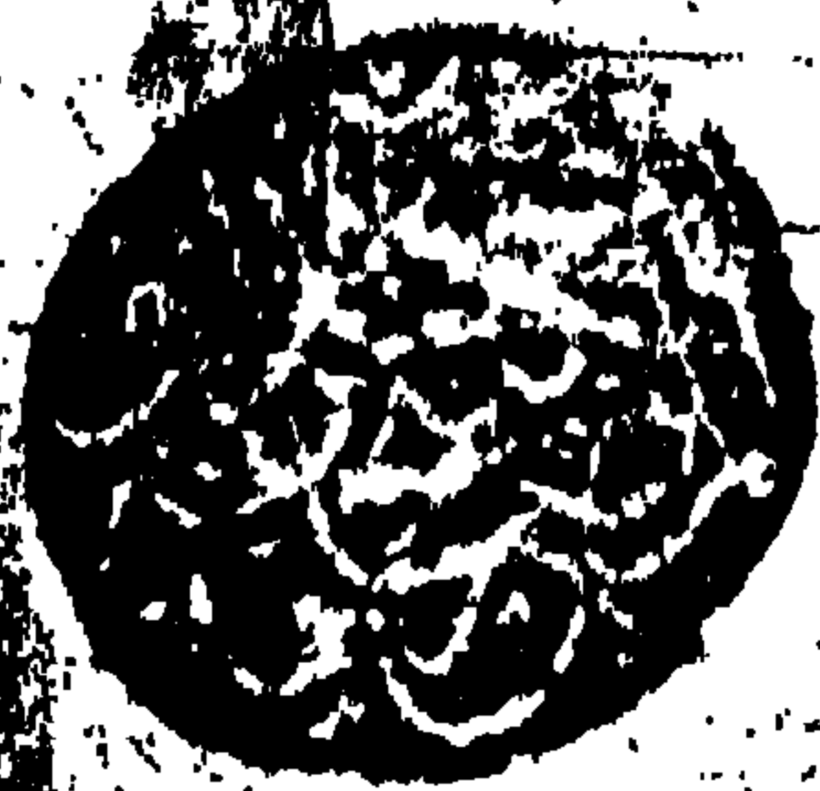
صورة عنوان نسخة دار الكتب المصرية برقم ١٣١٥