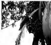
Ara México

individuos de ambas especies procedentes tanto de Sudamérica como de criaderos de diferentes partes del mundo.