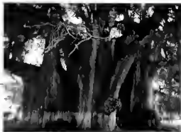
Arbol sagrado de Santa María del Tula

en que se encuentra, así como por el cuidado que le brinda la población de Xochimilco.