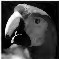
Aratinga maculosa

La distribución original de la guacamaya escarlata abarcaba desde el noreste de México hasta el sur de Brasil. En nuestro país esta especie habitó hasta mediados de este siglo en los estados de Tamaulipas, Veracruz, San Luis Potosí, Oaxaca, Tabasco, Chiapas y Campeche. Actualmente se tiene confirmada la existencia de dos poblaciones silvestres muy aisladas y reducidas, la más viable en la selva Lacandona en el estado de Chiapas y otra pe-