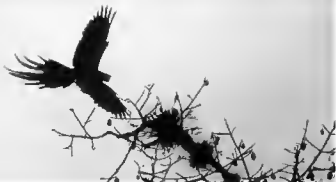
Ara macao

persecución directa de traficantes de aves silvestres así como la destrucción de sus hábitats.