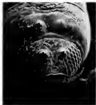
Fig. 1. Imagen de microscopio de barrido electrónico del caparazón y penúltimo en vista dorsal del isópodo de Esothena conabioae .

La diversidad y éxito de los isópodos se manifiesta en el gran número de ambientes que ocupan, desde la zonas intermareal hasta ambientes de mar profundo. Son básicamente organismos bentónicos, o sea asociados con el fondo, si bien en ocasiones pueden trasladarse a lo alto de la columna de agua, por ejemplo en busca de alimento. Habitan, entre otros sustratos, en raíces de manglar, en fondos blandos (lodo o lodo mezclado con arena), en pastos marinos, en comunidades de macroalgas, entre corales y rocas o bien pueden ocupar sustratos típicamente arenosos. Es posible encontrar a los isópodos como habitantes de ambientes marinos, dulceacuicolas, estuarinos o bien en ambientes netamente terrestres.