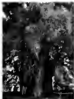
Ahuehuete de Santa María del Tule

E L AHUEHUETE ( Taxodium mucronatum ) es una especie fibrosa muy apreciada por su belleza, aspecto majestuoso y larga vida. En demérito de América del Norte y domesticado probablemente por los aztecas con fines ornamentales, es un árbol fuertemente atrigado en las tradiciones mexicanas prehispánicas, ligado a la historia y leyendas del país.