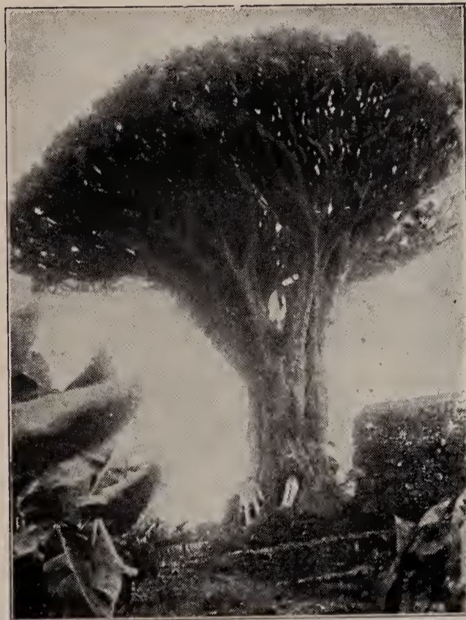
(Der berühmte Drachenbaum auf Tenerife)