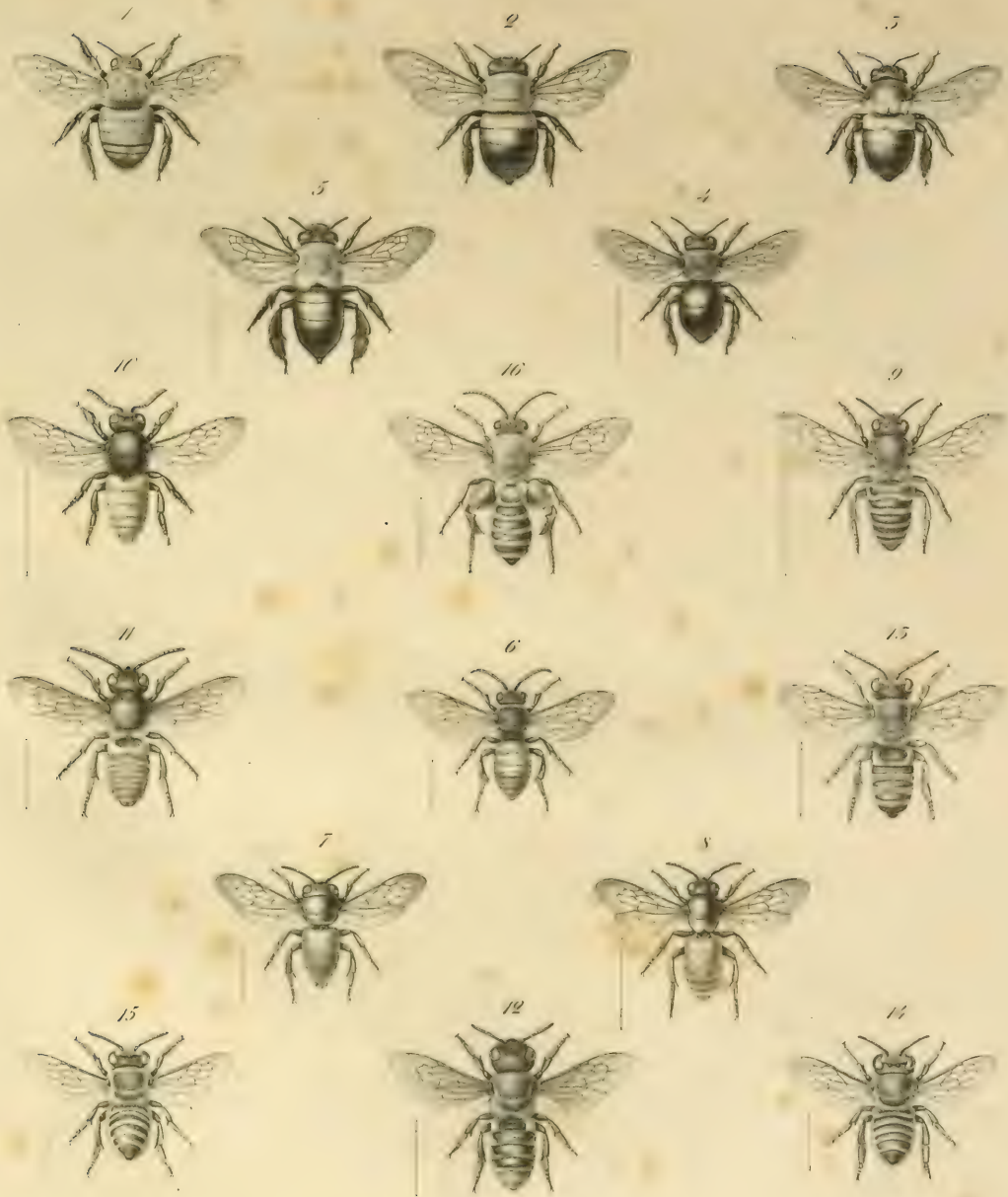
1. 2. Xylocopa lateritia , Sm. mas. fem. 3. X. caffra , L. fem. var. 4. X. lugubris , Gerst. fem. 5. Anthophora flavicollis , G. fem. 6. Lipotriches abdominalis , G. 7. 8. Eucaspis rufiventris , G. mas. fem. 9. Megachile felina , G. fem. 10. M. bombiformis , G. mas. 11. M. larvata , G. mas. 12. M. chrysoorrhoea , G. fem. 13. M. xanthopus , G. mas. 14. M. curtula , G. fem. 15. M. gratiosa , G. fem. 16. Nomia vulpina , G. mas.