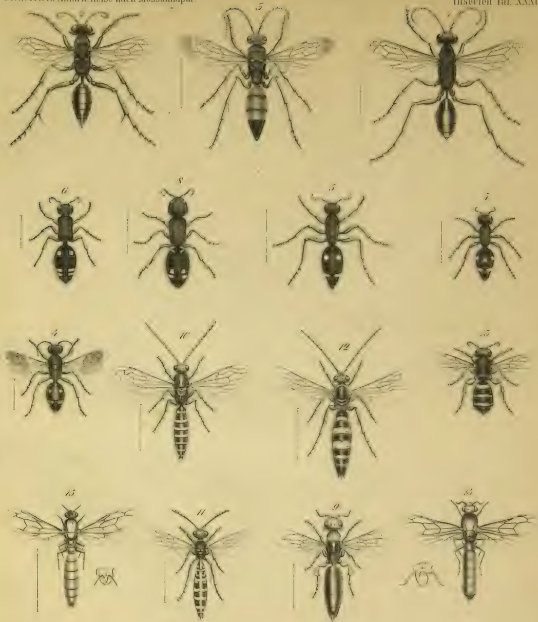
1. Chlorion fulvipes , Gerst. 2. C. subryancum , G. 3. Pompilus irpex , G. 4. 5. Mutilla Guineensis , Fabr. mas. fem. 6. M. aestivans , G. 7. M. Teltensis , G. 8. M. bilunata , G. 9. Meria semirufa , G. 10. Myzine cingulata , G. 11. Scolia pardalina , G. 12. 13. S. mansueta , G. mas. fem. 14. Dorylus badius , G. 15. D. diadema , G.