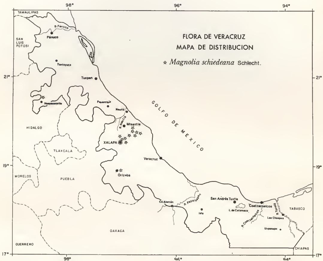
Fig. 1. Magnolia schiedeana . a, rama con flor; b, corte longitudinal del eje floral; c, estambre visto de frente; d, fruto multifollicular; e, semilla con un fragmento del funículo. Ilustración por Elvia Esparza A., basada en el ejemplar Hernández-Cerda 13 .