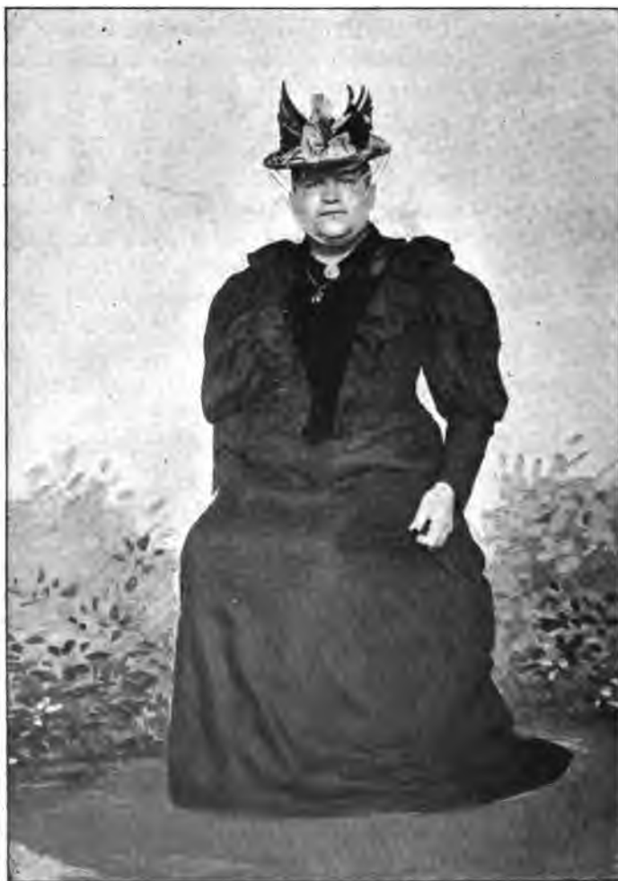
Photographie eines Urnings. (vgl. Seite 335)