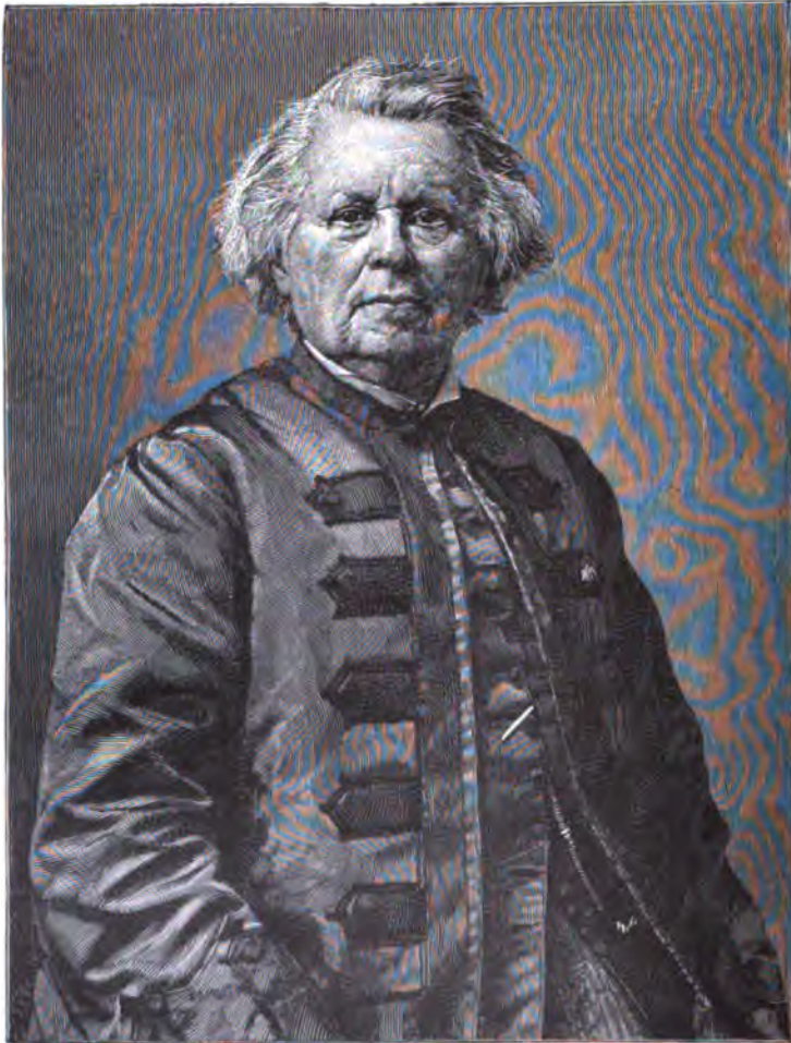
Rosa Bonheur (nach der letzten Photographie), berühmte französische Tiermalerin, verstorben im Mai 1899, seelisch und körperlich ausgesprochener Typus einer sexuellen Zwischenstufe.