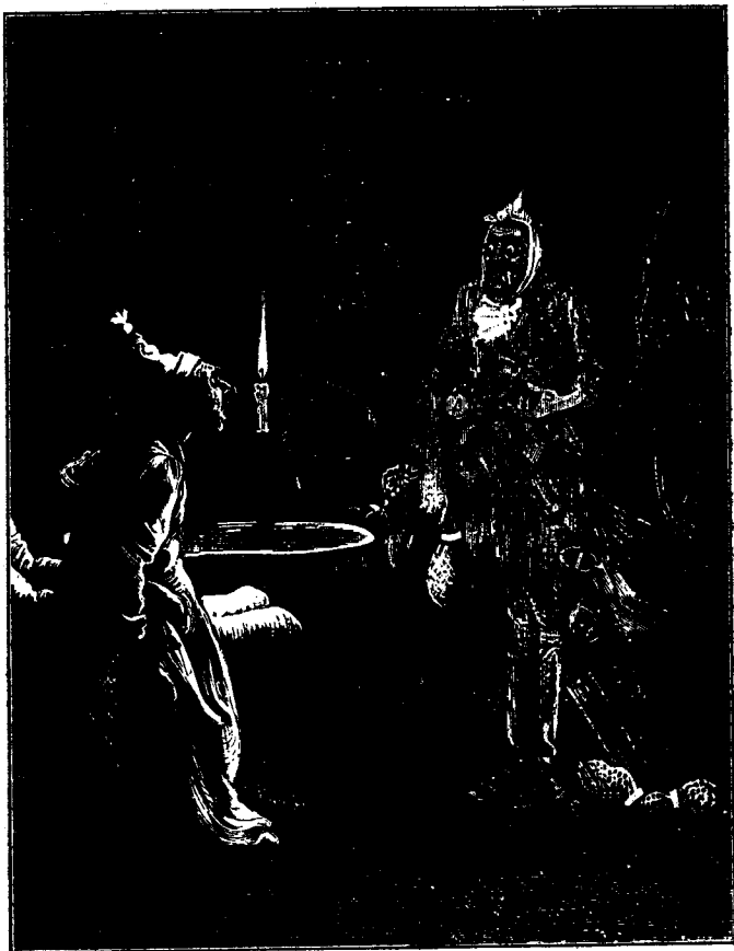
„Ik ken hem: Marley's geest!” (Blz. 9.)

„En je kijkt er niet naar!” zei Scrooge.