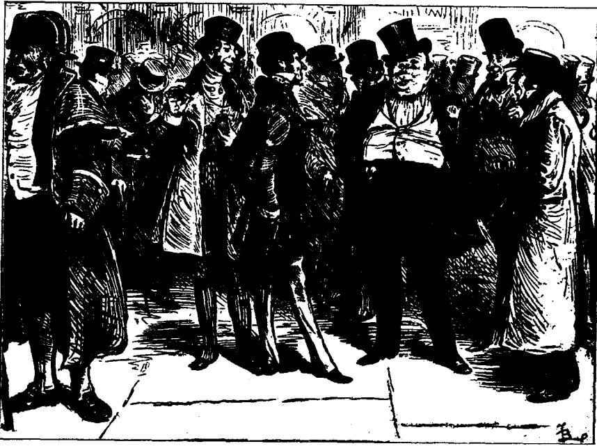
„Deze aardigheid werd met algemeen gelach begroet.” (Blz. 41.)

winkels, halfnaakte, dronken, have-looze menschen met morsige gezichten en afgetrapte schoenen. Sloppen en gangen loosden hun vuil en slijk in de stegen, alsof deze zinkputten waren, en de geheele wijk ademde misdaad, ellende en onreinheid.