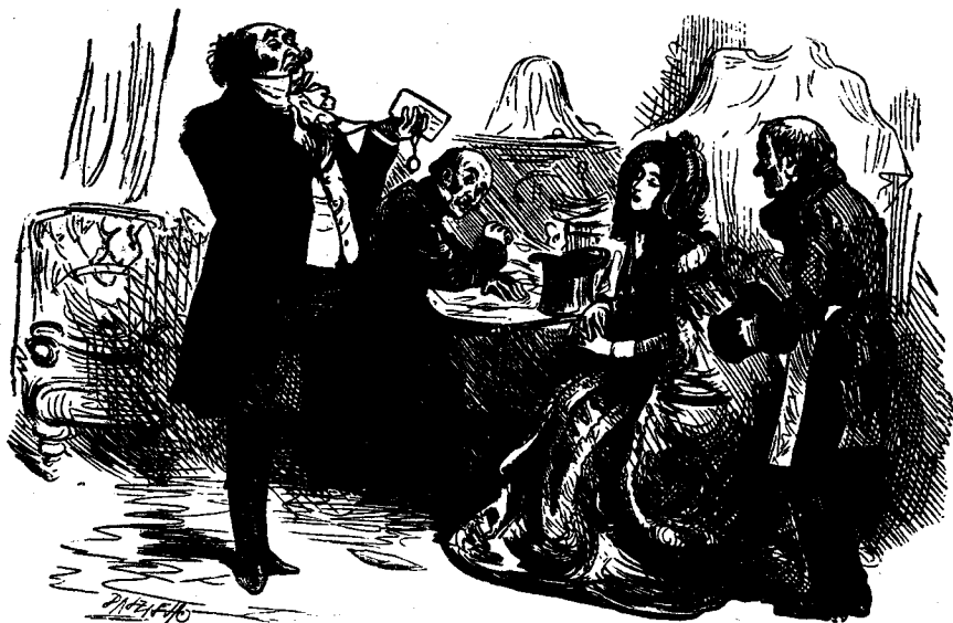
„De vriend der arme mensen." (Blz. 75.)

den bankier, en hij bewijst mij de gunst mij te vragen of het mij aangenaam zijn zal Will Fern van de baan te helpen."